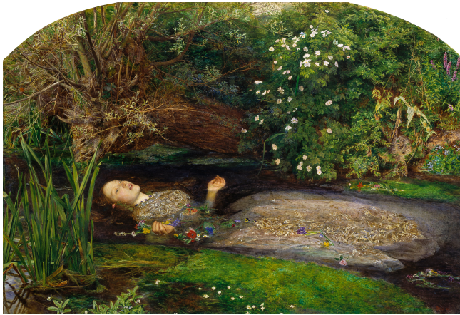
Fig. 2 : Ophelia , John Everett Millais, huile sur toile, 1851-1852