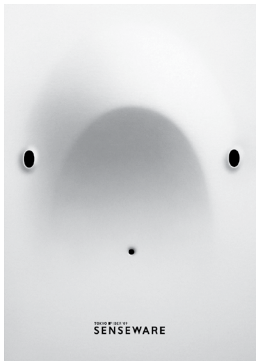
Il. 12. Plakat Senseware. Tokyo Fiber '09 , offset barwny, 145,5 x 103 cm, kolekcja Muzeum Narodowego w Poznaniu MNP Plo 15735