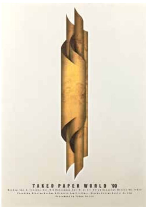
Il. 6. Plakat Takeo Paper World '90 , offset barwny, 103 x 73 cm, kolekcja Muzeum Narodowego w Poznaniu MNP Plo 8275