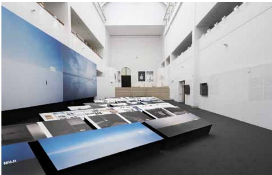
Il. 2. Wystawa Kenya Hara. Make The Future Better Than Today . Laureat Nagrody im. Jana Lenicy 2020, 24 marca–30 lipca 2023, Muzeum Narodowe w Poznaniu, przestrzeń głównego holu – Projekty dla firmy MUJI (Mujirushi Ryōhin)