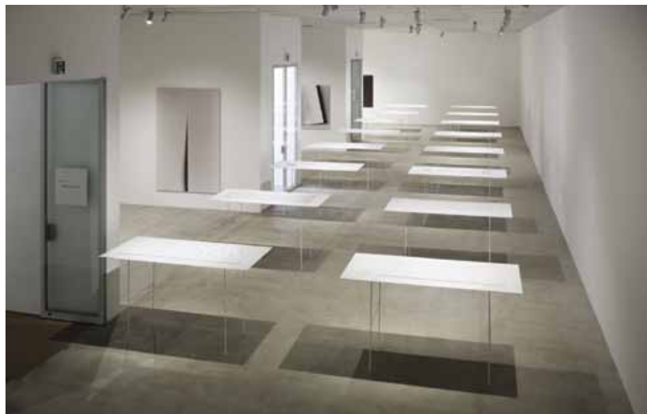
Il. 11. Wystawa Subtle. Takeo Paper Show 2014 , Tokio