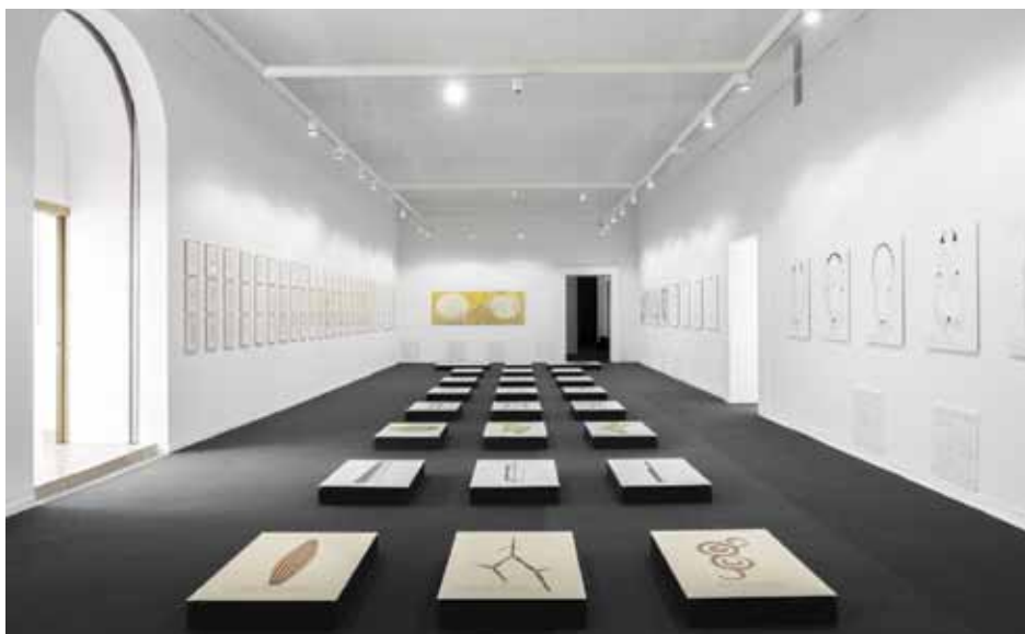
Il. 5. Wystawa Kenya Hara. Make The Future Better Than Today. Laureat Nagrody im. Jana Lenicy 2020 , 24 marca–30 lipca 2023, Muzeum Narodowe w Poznaniu, przestrzeń w ciemnej sali – Plakaty i szkice