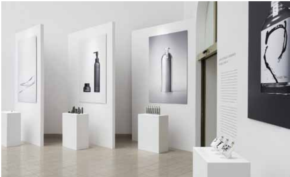
Il. 4. Wystawa Kenya Hara. Make The Future Better Than Today . Laureat Nagrody im. Jana Lenicy 2020, 24 marca–30 lipca 2023, Muzeum Narodowe w Poznaniu, przestrzeń głównego holu nad schodami – Projektowanie opakowań