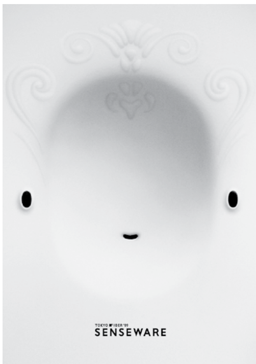
Il. 13. Plakat Senseware. Tokyo Fiber '09 , offset barwny, 145,5 x 103 cm, kolekcja Muzeum Narodowego w Poznaniu MNP Plo 15736