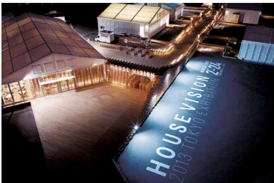
Il. 14. Wystawa House Vision 2013 Tokyo Exhibition , Tokio