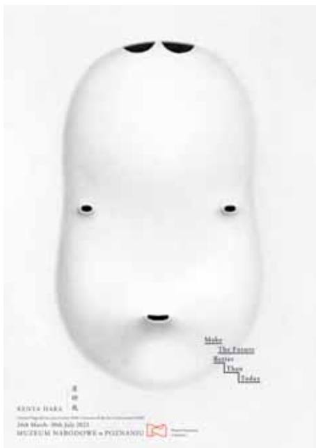
Il. 1. Plakat Make The Future Better Than Today . Kenya Hara. Laureat Nagrody im. Jana Lenicy 2020. 24th March – 30th July 2023, Muzeum Narodowe w Poznaniu, druk cyfrowy, 103 x 73 cm, kolekcja Muzeum Narodowego w Poznaniu MNP Plo 15743