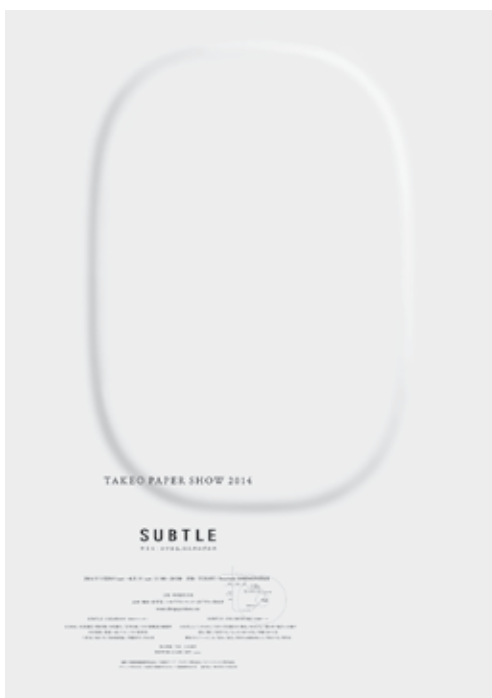
10. Plakat Subtle. Takeo Paper Show 2014 , offset barwny, 145,5 x 103 cm, kolekcja Muzeum Narodowego w Poznaniu MNP Plo 15738