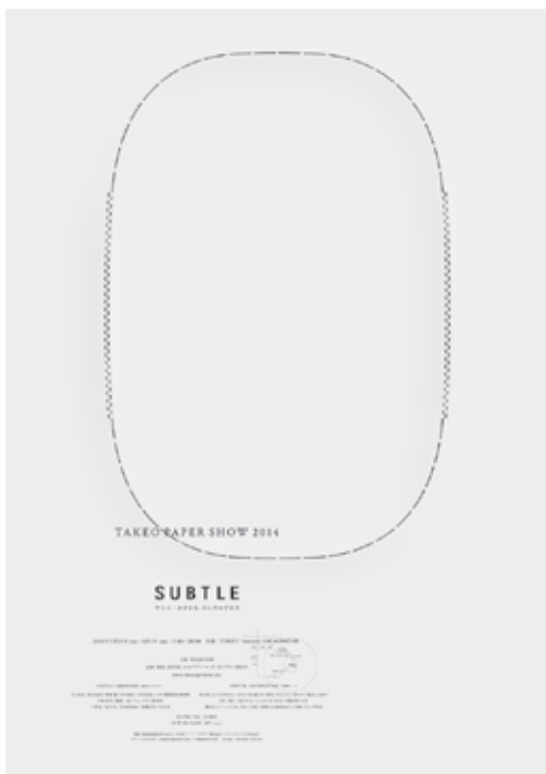
Il. 9. Plakat Subtle. Takeo Paper Show 2014 , offset barwny, 145,5 x 103 cm, kolekcja Muzeum Narodowego w Poznaniu MNP Plo 15739