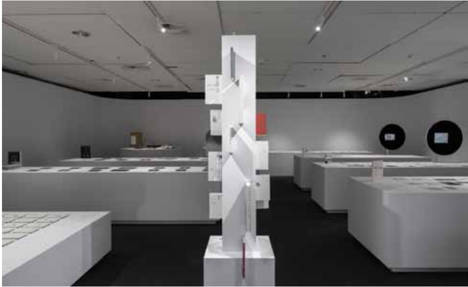
Il. 3. Wystawa Kenya Hara. Make The Future Better Than Today . Laureat Nagrody im. Jana Lenicy 2020, 24 marca–30 lipca 2023, Muzeum Narodowe w Poznaniu, mała salka – Działalność edytorska i kuratorska