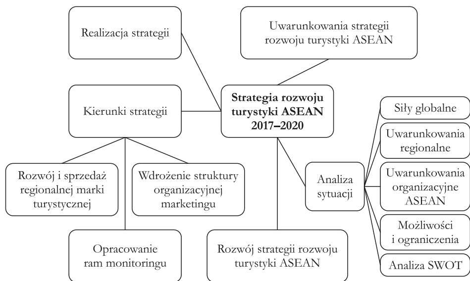
Rys. 1. Struktura marketingu turystycznego ASEAN na lata 2017–2020