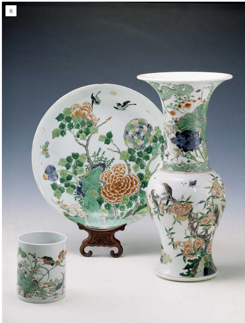
Ryc. 8. Duży talerz, wazon i pojemnik na pędzle zdobione emaliami naszkliwnymi w paletce barwnej Kangxi wucai , okres panowania cesarza Kangxi, pocz. XVIII w., Nasjonal Museet (Oslo)