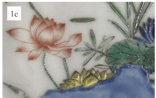
Ryc. 1. Talerz porcelanowy zdobiony emaliami naszkliwnymi w palecie barwnej Kangxi wucai , pierwsza ćwierć XVIII w., MNG/SD/1529/CS, Muzeum Narodowe w Gdańsku; 1a. przód talerza; 1b. tył talerza; 1c. fragment reliefowej bordiury; 1d. fragmenty kwiatu lotosu czerwono-różowego; 1e. fragment kwiatu lotosu żółto-złotego