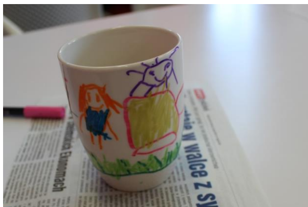
Ryc. 8. Malowanie ceramiki (z kolekcji autorki)

Zgodnie z zadeklarowanymi na początku zajęć zainteresowaniami i podejmowanymi tematami w pracach dyplomowych, podjęto dyskusję na temat bazgroły dziecięcej. Najnowsze badania w zakresie stymulowania percepcji wzrokowej dzieci 2- i 3- letnich zakresie barwy, linii i bryły znalazły odzwierciedlenie w scenariuszach zajęć tworzonych przez studentki dla grup przedszkolnych (Szuścik 2019). Zaproszeni pasjonaci fotografii i scrapbookingu w profesjonalny sposób wprowadzili studentów w tajniki tych ciekawych aktywności. Podczas profesjonalnej sesji fotograficznej zostały wykonane zdjęcia indywidualne, grupowe, tematyczne i portretowe do przygotowywanego na zaliczenie przedmiotu kalendarza. Poznanie techniki scrapbookingu pozwoliło na wykonanie kartek świątecznych, upominków bożonarodzeniowych dla gości zaproszonych na spotkanie opłatkowe oraz na włączenie się w akcje charytatywne organizowane przez Koła Naukowe.