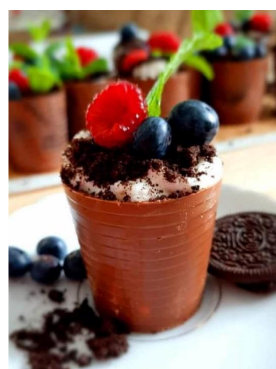
Ryc. 4., Ryc. 5., Ryc. 6. Eat - art (z kolekcji autorki)

Wspólnie zaplanowali i zrealizowali warsztaty z elementami arteterapii z wykorzystaniem technik plastycznych wspierających rozwój dzieci z różnych środowisk kulturowych. Podczas każdego bloku zajęć słuchacze dokonywali indywidualnie lub grupowo analizy wybranych dzieł sztuki gromadząc zdobyte informacje oraz reprodukcje dzieł sztuki w oryginalnych lapbookach. Łącznie dokonano analizy 30 dzieł sztuki, które stały się podstawą realizacji zadań plastycznych.