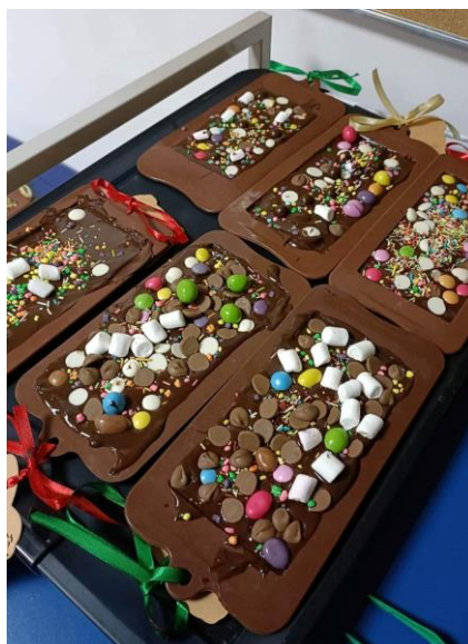
Ryc. 15. Warsztaty czekoladowe

Program zajęć jest na bieżąco poddawany ewaluacji. Warto w przyszłości, włączyć do programu nowe techniki plastyczne takie jak graffiti oraz grafika komputerowa. Program będzie wymagał dostosowania do potrzeb kolejnej grupy studentów w następnym roku akademickim. Jest to program bazujący na doświadczeniach i wiedzy kadry naukowej, ale jednocześnie bardzo czuły na potrzeby studentów i zasoby środowiska. Żyjemy w świecie, który bardzo szybko się zmienia. Program kształcenia studentów, a tym samym kształcenie dzieci i uczniów w zakresie edukacji plastycznej, powinien nadążać za osiągnięciami naukowymi i światową sztuką. Warto rozważyć podjęcie badań naukowych w zakresie kompetencji plastycznych studentów, nauczycieli edukacji przedszkolnej i wczesnoszkolnej oraz nauczycieli akademickich. Doposażyć pracownię plastyczną oraz zainicjować działalność Koła artystycznego pozwalającego na rozwijanie pasji artystycznej studentów na każdym etapie kształcenia uniwersyteckiego.