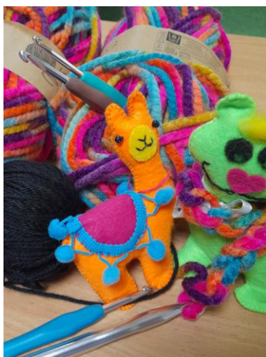
Ryc.7. Robótki ręczne (z kolekcji autorki)

Wszyscy studenci zadeklarowali w wypełnionej ankiecie ewaluacyjnej, że bez względu na to, w jakiej placówce będą pracować, wykorzystają zdobyte doświadczenia, wiedzę i umiejętności do twórczego organizowania zajęć plastycznych w szkole i przedszkolu. Niezwykle inspirujące było również dzielenie się wiedzą. Studentki podzieliły się w trakcie ćwiczeń swoimi pasjami i zdolnościami w zakresie szycia, robótek ręcznych oraz Quillingu. Z ich inicjatywy przeprowadzone zostały warsztaty, nazywane przez nas, rzemieślniczymi lub rękodzielniczymi: warsztaty czekoladowe, mydlarskie, świece sojowe, odlewy gipsowe, upominki i kartki okolicznościowe, oraz malowanie ceramiki. Nowo zdobytą wiedzę i umiejętności wykorzystywały w czasie zajęć praktycznych z dziećmi podczas praktyk asystenckich i ciągłych realizowanych w szkołach i przedszkolach.