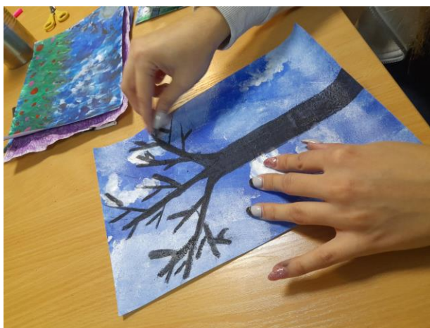
Ryc. 12. Malowanie węglem na podobrazii wykonanym metodą tapowania za pomocą gąbki (z kolekcji autorki)

Podczas zajęć studenci mieli możliwość wypróbowania wielu technik plastycznych, przy użyciu profesjonalnych narzędzi. Wspólnie poszukiwaliśmy również alternatywnych, tańszych i naturalnych zamienników, które w przyszłości pozwolą na realizację zajęć przy niskim budżecie. Studenci poznali techniki plastyczne z przykładowymi zadaniami, które mają inspirować i motywować do poszukiwania w przyszłości nowych dróg i realizowania własnych pomysłów.