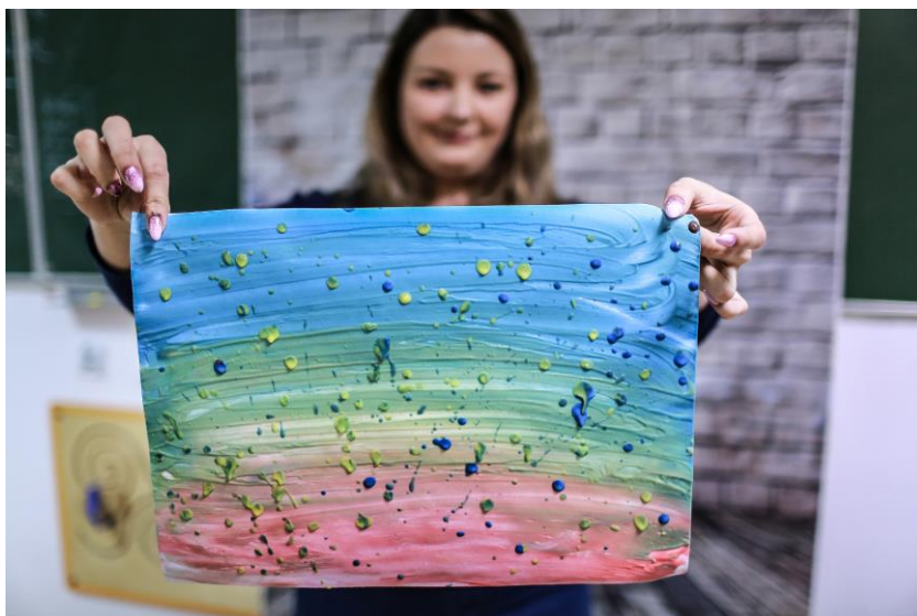
Ryc. 2., i Ryc. 3. Action painting (z kolekcji autorki)