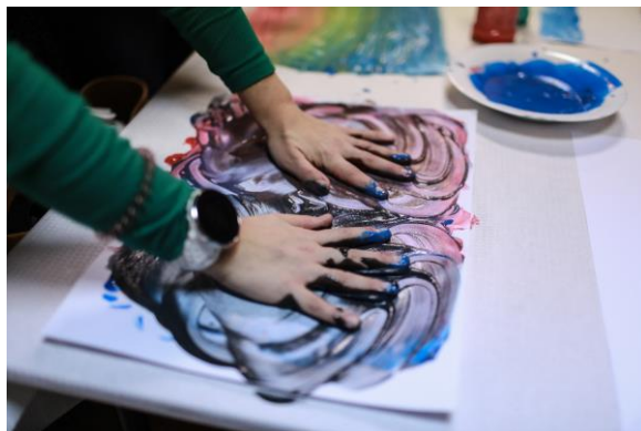
Ryc. 14. Metoda malowania dziesięcioma palcami