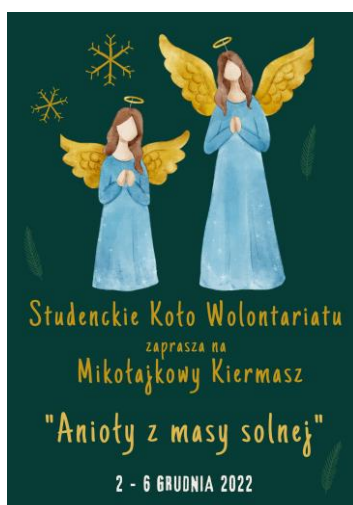
Ryc. 1. Plakat wykonany przy użyciu narzędzi multimedialnych (z kolekcji autorki)

Na podstawie zdobytej wiedzy, studenci przygotowali projekty konkursów plastycznych oraz zajęć plastycznych. Stworzyli ciekawe plakaty, kalendarze, ogłoszenia, scenariusze i regulaminy konkursów dla różnych grup odbiorców. Wdrożenie zasady indywidualizacji pozwoliło na dostosowanie weryfikacji wiedzy i umiejętności.