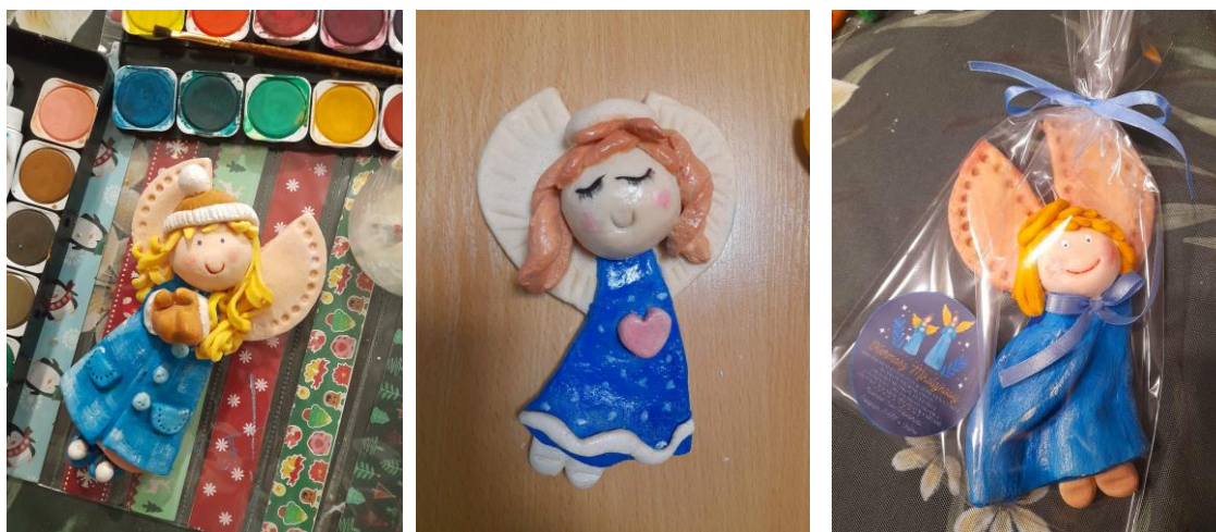
Ryc. 9., Ryc. 10., Ryc. 11. Anioły z masy solnej (z kolekcji autorki)

Dużym i bardzo owocnym przedsięwzięciem było włączenie się w akcję organizowaną przez Studenckie Koło Wolontariatu Pedagogiki PANS i przygotowanie aniołów z masy solnej oraz stroików.