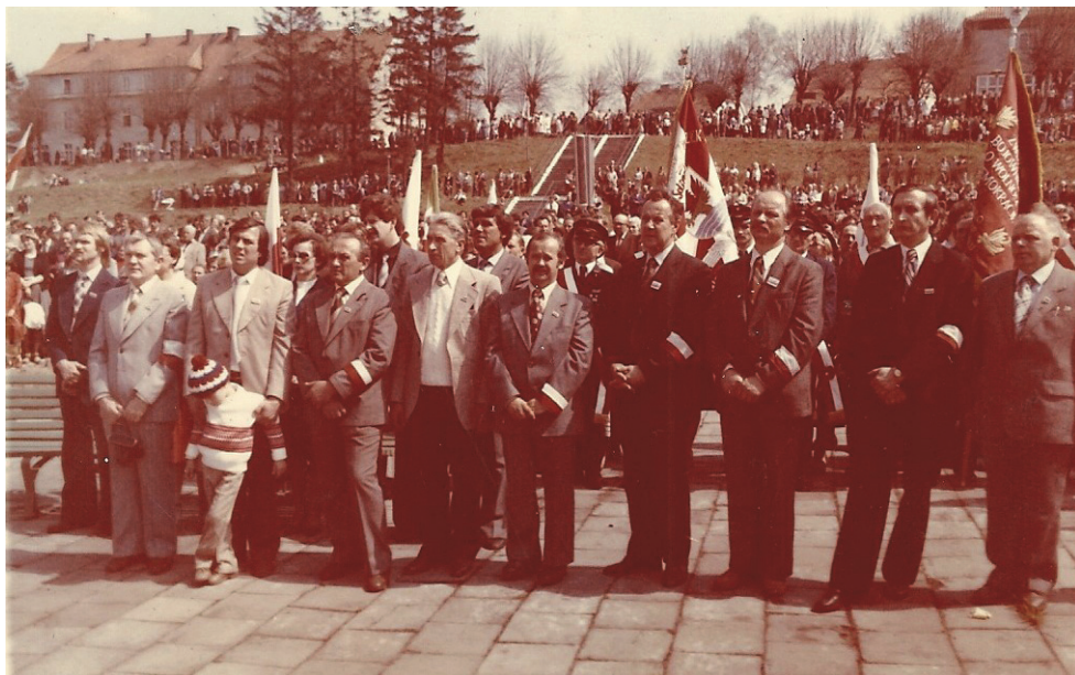
Fot. 2. Działacze MKK NSZZ „Solidarność” w Miastku podczas mszy 9 maja 1981 roku