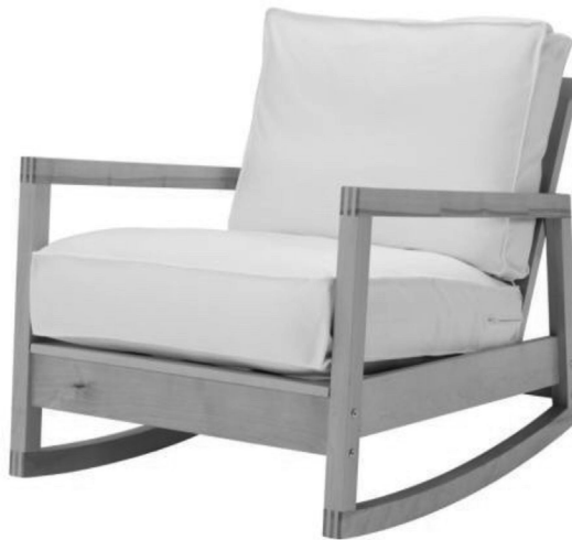
Ilustracja 7. Fotel Lillberg, IKEA