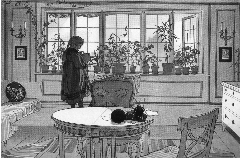
Ilustracja 5. C. Larsson, Ukwieczone okno (szw. Blomsterfönstret ), 1894, akwarela na papierze 32 × 43 cm, Nationalmuseum, Sztokholm