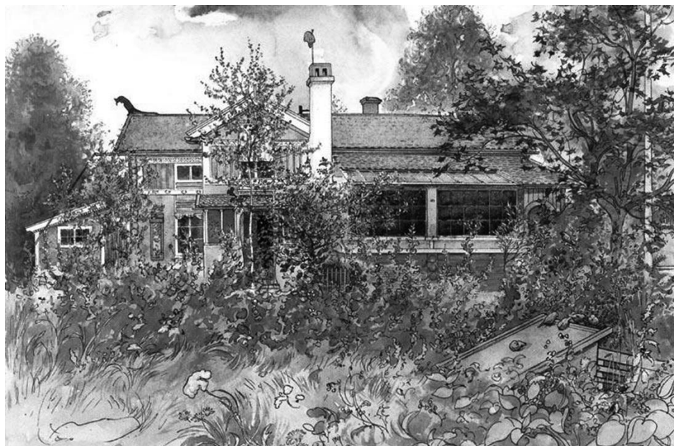
Ilustracja 1. C. Larsson, Chatka (szw. Stugan ), ok. 1895, akwarela na papierze 32 × 43 cm, Nationalmuseum, Sztokholm