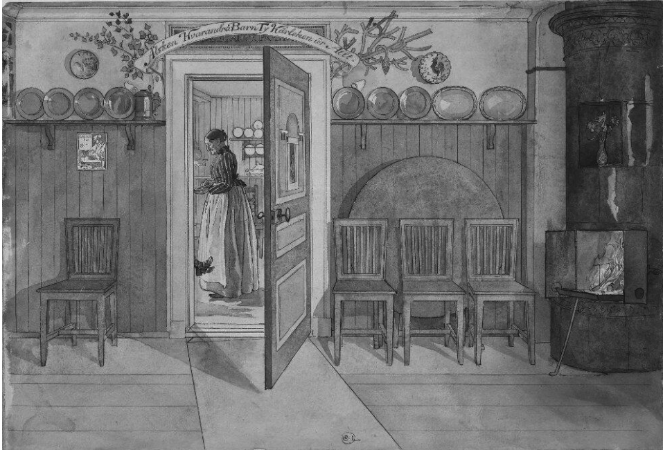
Ilustracja 2. C. Larsson, Stara Anna (szw. Gamla Anna ), między 1890 a 1899, akwarela na papierze 32 × 43 cm, Nationalmuseum, Sztokholm

wnętrzach. Z uwagi na ograniczenie przestrzeni zastosowano liczne rozwiązania pozwalające na zachowanie maksymalnej przestronności wewnątrz: w jadalni i kuchni zaprojektowano system półek na naczynia i wsporników do wieszania dzbanów, zaś drzwi pomiędzy tymi pokojami w razie potrzeby miały podtrzymywać rozkładany stół, który na co dzień stał oparty o ścianę, przysłonięty krzesłami (ilustracja 2). W samej kuchni zwraca uwagę także widoczna ilość wolnego miejsca, która pozwalała na swobodne wykonywanie podstawowych prac.