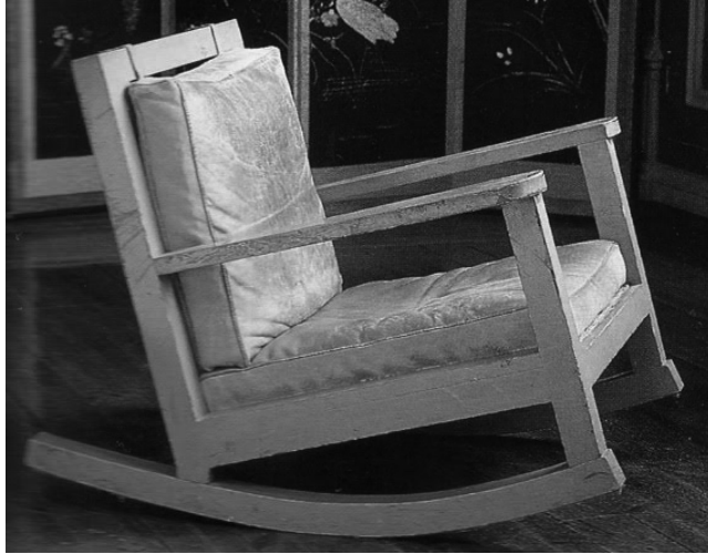
Ilustracja 6. Fotel bujany zaprojektowany przez Karin Larsson