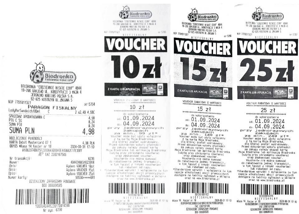
Rysunek 2. Paragon fiskalny wydawany w sieci sklepów Biedronka

Do paragonów fiskalnych sieci Biedronka nierzadko dołączane są vouchery. Jak przedstawia poniższy rysunek, dowód zakupu tylko jednej pozycji, wraz z dołączonymi voucherami może osiągać długość nawet 88 centymetrów. Potwierdzenie płatności stanowi niecałe 15% całkowitego rozmiaru wydruku i wynosi 13 centymetrów, natomiast każda z ofert promocyjnych ma długość 25 cm.