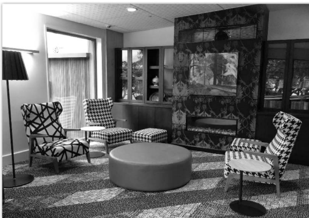
Fotografia 5. Biblioteka Devonport. Salon historyczny