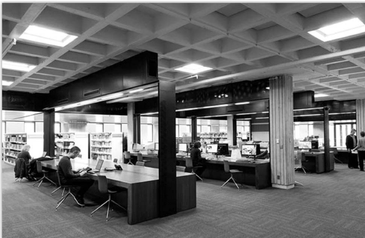
Fotografia 3. National Library of New Zealand, Reading room, 2013 r.