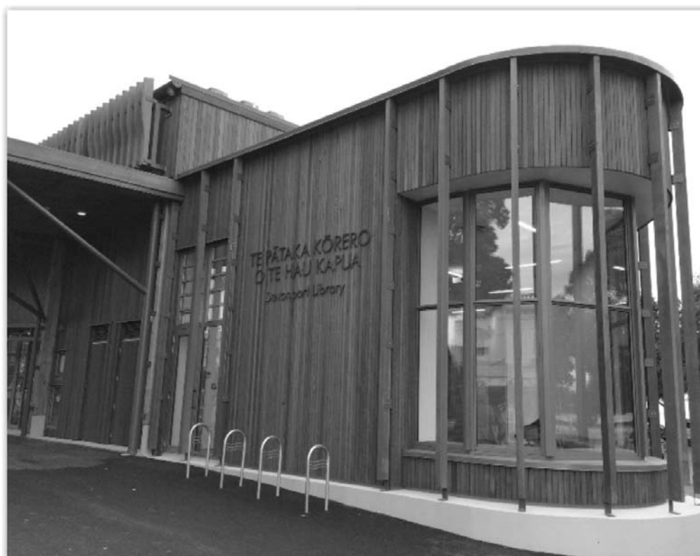
Fotografia 6. Biblioteka Devonport. Widok fasady