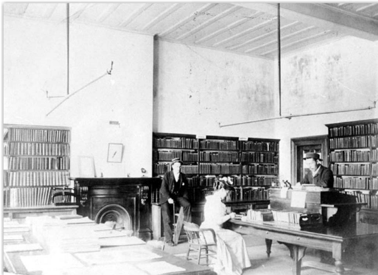
Fotografia 1. Timaru Mechanics' Institute library, 1887 r.