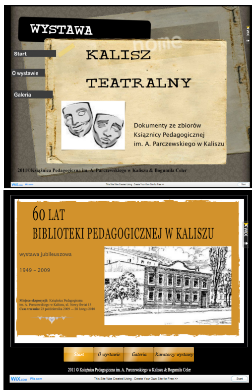
Rysunek 3. Przykładowe wirtualne wystawy Książnicy Pedagogicznej im. A. Parczewskiego w Kaliszu