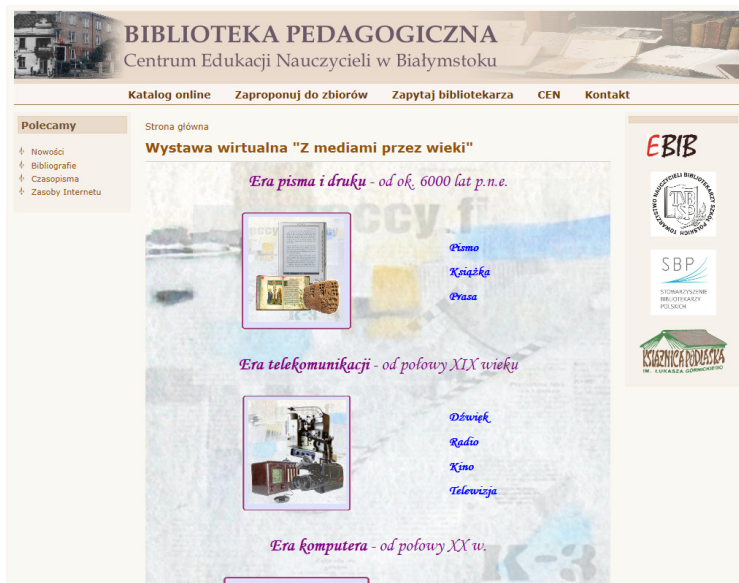
Rysunek 4. Wystawa wirtualna Z mediami przez wieki Biblioteki Pedagogicznej Centrum Edukacji Nauczycieli w Białymstoku

Źródło: http://biblioteka.bialystok.edu.pl/cms/?q=node/290 .