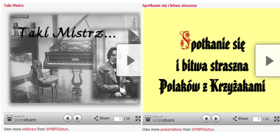
Rysunek 1. Przykładowe wirtualne wystawy z Galerii Bakalarz Warmińsko-Mazurskiej Biblioteki Pedagogicznej w Olsztynie