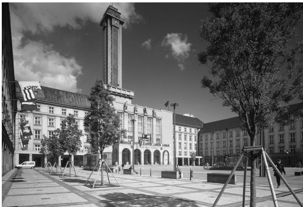
Fotografia 7. Ratusz w Ostrawie