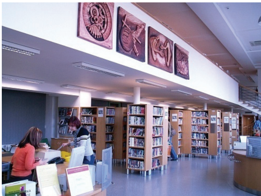
Fotografia 5. Czytelnia Biblioteki Miasta Ostrawy