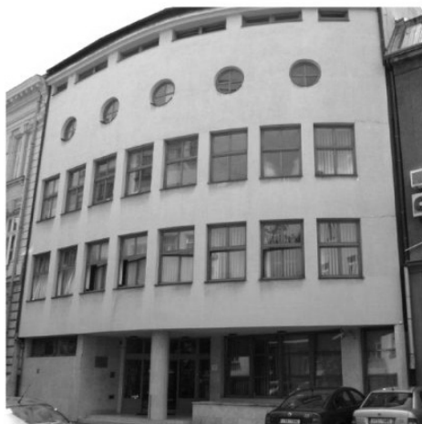
Fotografia 1. Gmach główny Biblioteki Uniwersyteckiej w Ostrawie przy ulicy Brafova 3