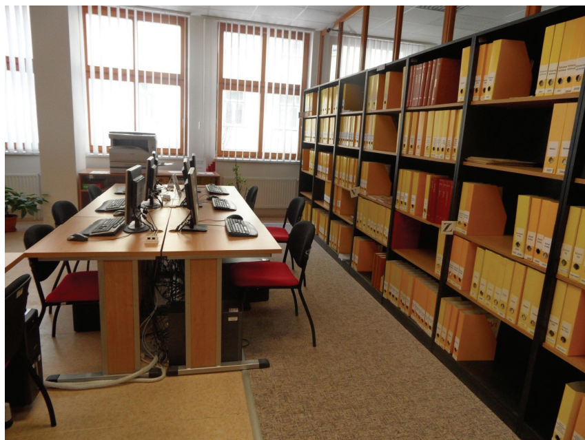
Fotografia 4. Czytelnia czasopism