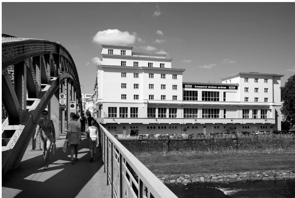
Fotografia 6. Gmach główny Biblioteki Miasta Ostrawy przy moście Sýkorův