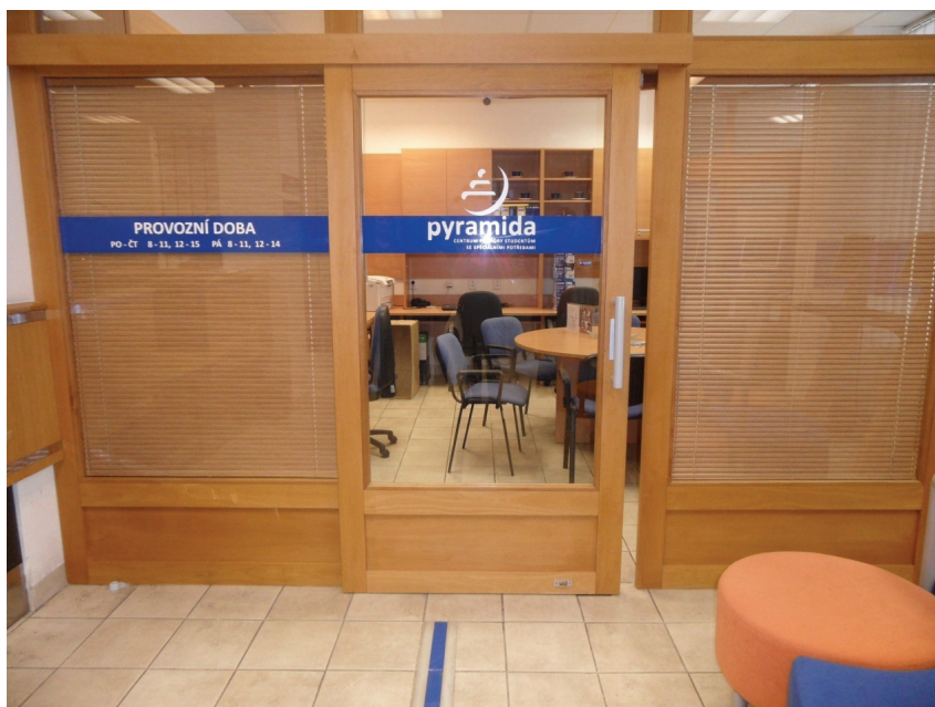
Fotografia 3. Centrum Pyramida