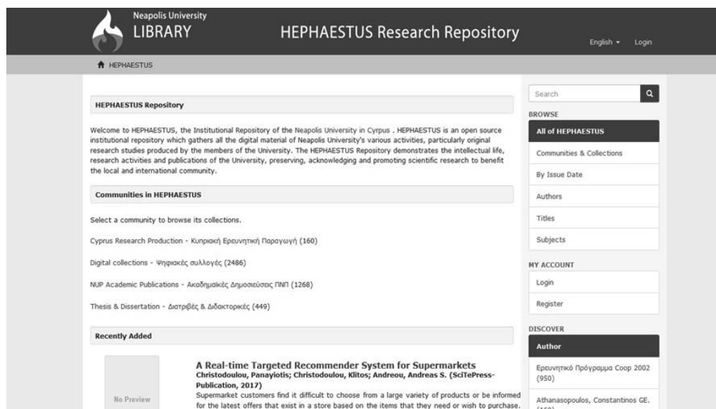
Rysunek 2. Repozytorium HEPHAESTUS na Uniwersytecie Neapolis w Pafos