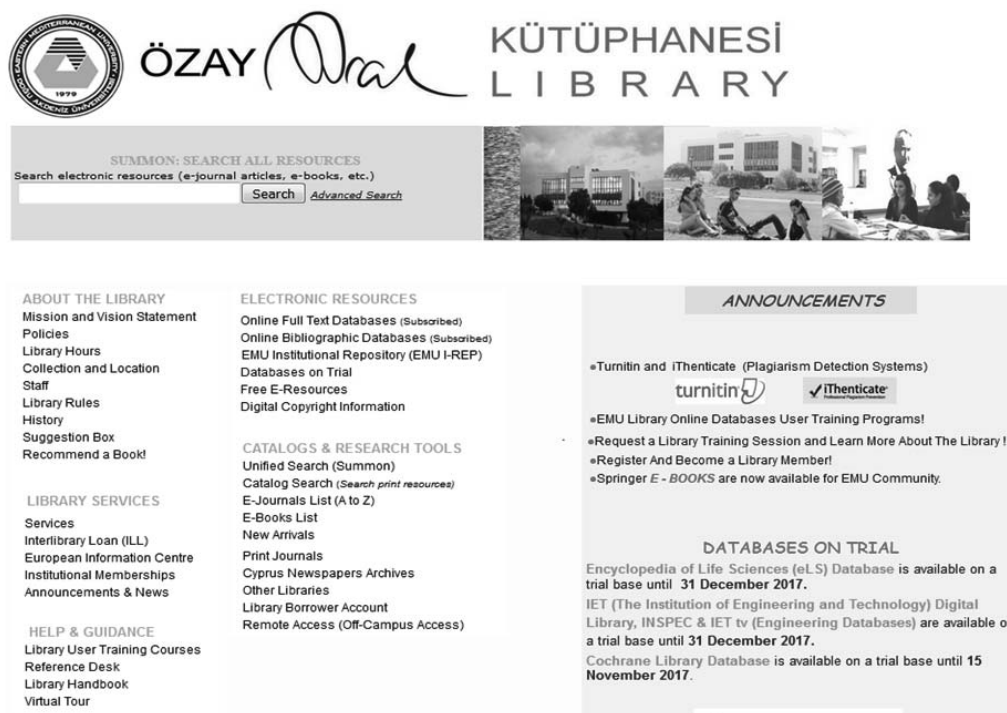
Rysunek 3. Strona www biblioteki Eastern Mediterranean University w Famagüście