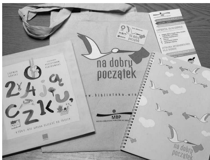
Fotografia 3. Wyprawka czytelnicza „Na dobry początek”