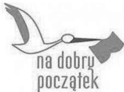
Fotografia 2. Logo projektu „Na dobry początek” MBP we Wrocławiu