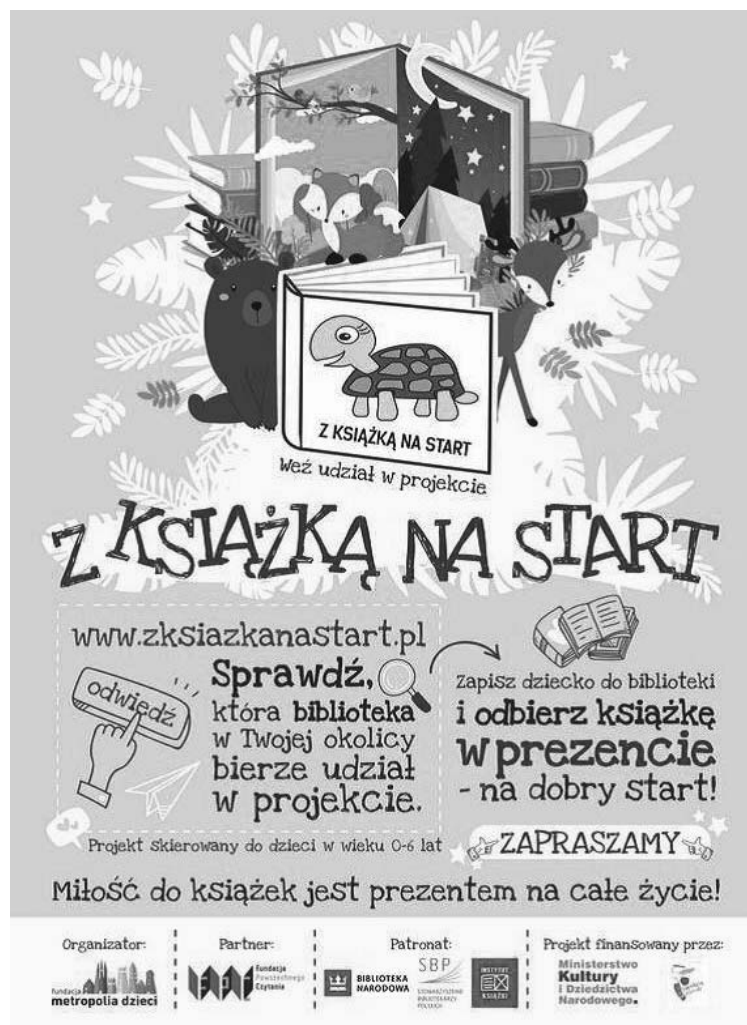
Fotografia 4. Plakat promujący projekt „Z książką na start”