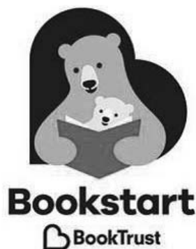
Fotografia 1. Logo programu Bookstart