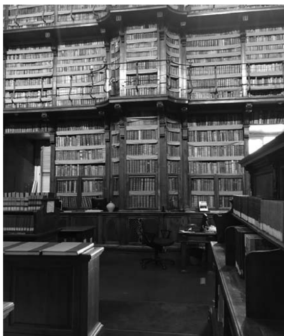
Fotografia 8. Czytelnia Biblioteki Angelica