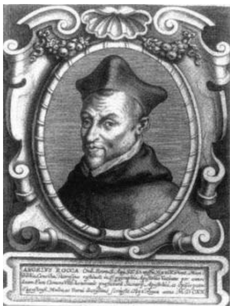
Fotografia 1. Portret biskupa Angelo Rocca