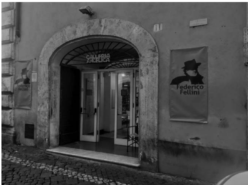
Fotografia 12. Wejście do Galerii Angelica

Na parterze Pałacu Sant`Agostino, obok pomieszczeń samej biblioteki, znajduje się galeria artystyczna poświęcona sztuce współczesnej. Galeria ma oddzielne wejście od via Sant`Agostino 11, ale jest bezpośrednio połączona z biblioteką (fot. 12).