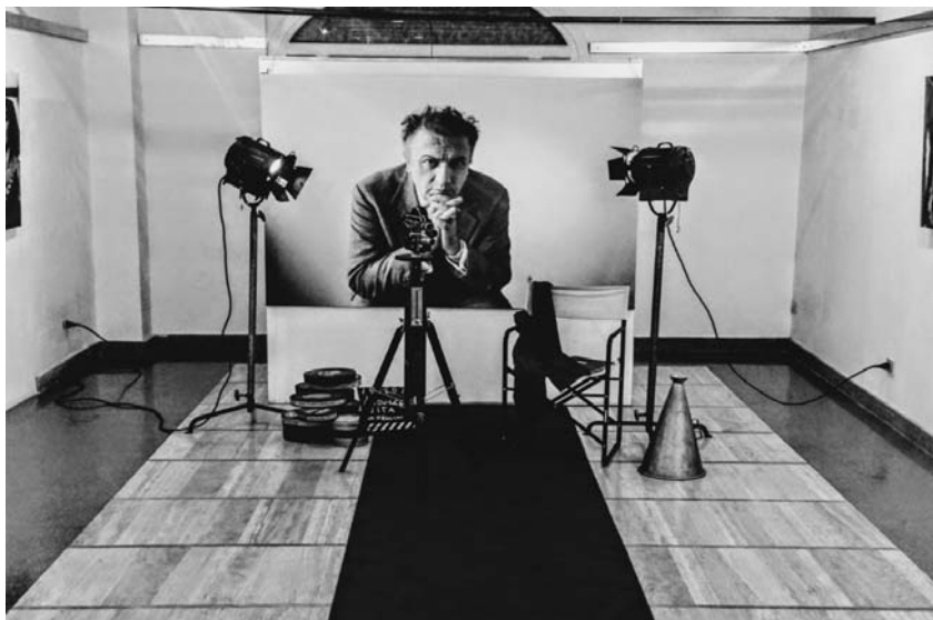
Fotografia 13. Wystawa w Galerii Angelica – Federico Fellini

stała się galerią sztuki współczesnej, w której organizowane są wystawy rzeźby, grafiki czy fotografii [9]. Często też pojawiają się tam wystawy tematyczne, poświęcone wielkim twórcom włoskim i zagranicznym, takim jak: Rafael, Banksy, Federico Fellini (fot. 13-14).