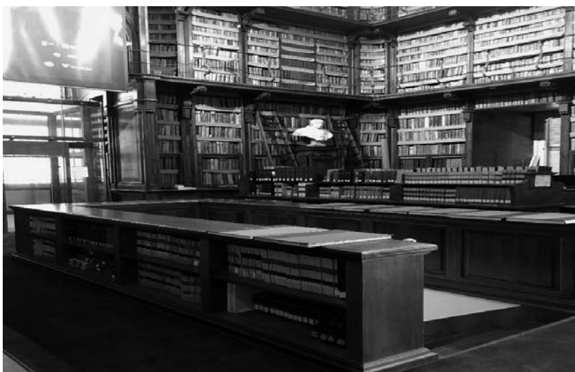
Fotografia 7. Czytelnia Biblioteki Angelica