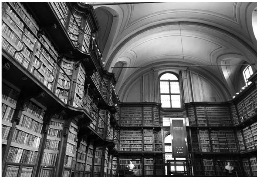
Fotografia 5. Czytelnia Biblioteki Angelica