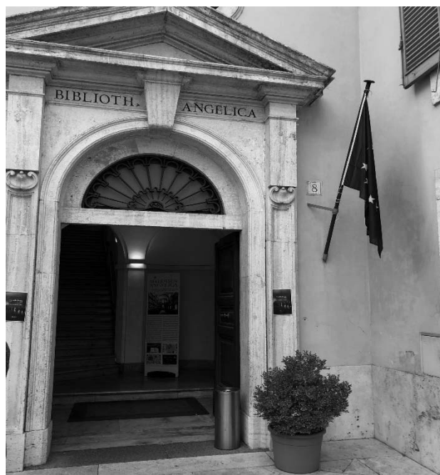
Fotografia 3. Wejście do biblioteki

Znacząca rozbudowa księgozbioru w 1762 r. wymusiła ostatecznie przebudowę klasztoru, która została zlecona przez przeora generalnego Francisco X Vazqueza. Ostatecznie biblioteka była zamknięta z powodu renowacji w latach 1748-1786, a po otwarciu czytelnicy mogli już korzystać z pisanych odręcznie katalogów bibliotecznych. Za rozbudowę i dzisiejszą aranżację czytelnicy odpowiedzialny jest architekt Luigi Vanvitelli [11, s. 26]. Obecnie biblioteka znajduje się na pierwszym piętrze budynku przy Piazza Di Sant'Agostino 8, do którego wejście prowadzi przez szerokie, drewniane drzwi (fot. 3).