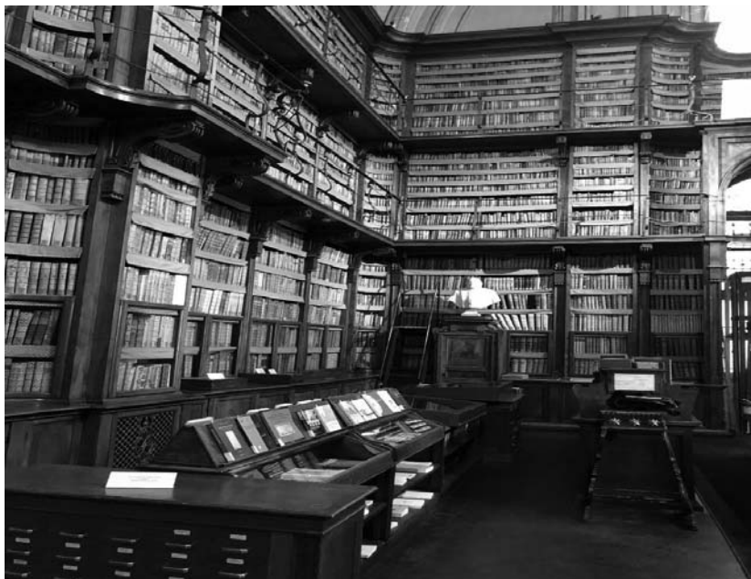
Fotografia 6. Czytelnia Biblioteki Angelica