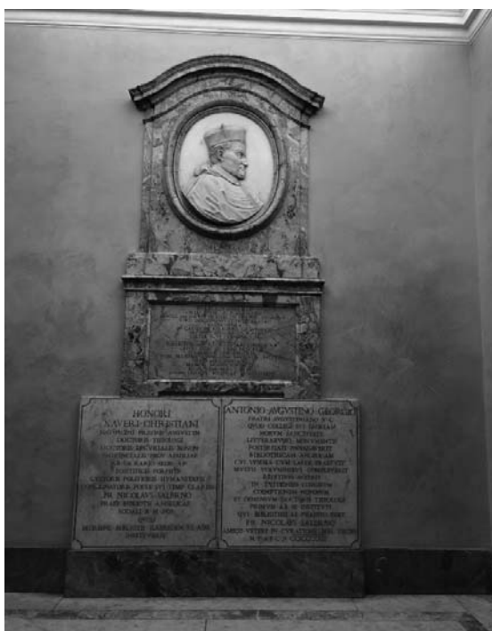
Fotografia 4. Płaskorzeźba z wizerunkiem Angelo Rocchae

Na szczycie schodów można podziwiać marmurowe popiersia: Klemensa XIII, Benedykta XIV, Enrico Norisa i Egidio Colonna (fot. 4).