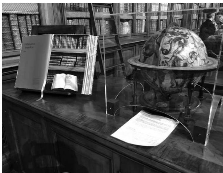
Fotografia 10. Ekspozycja w czytelni