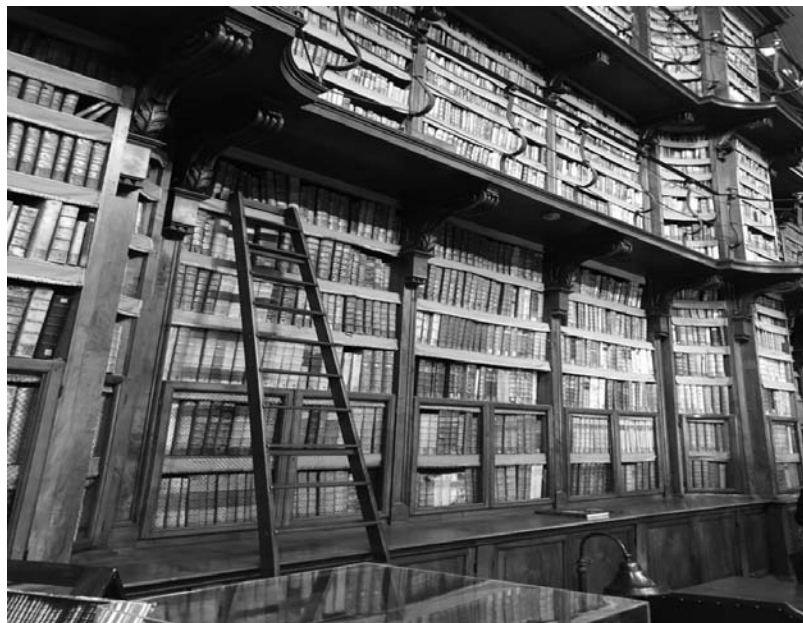
Fotografia 9. Czytelnia Biblioteki Angelica