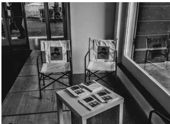
Fotografia 14. Wystawa w Galerii Angelica – Federico Fellini