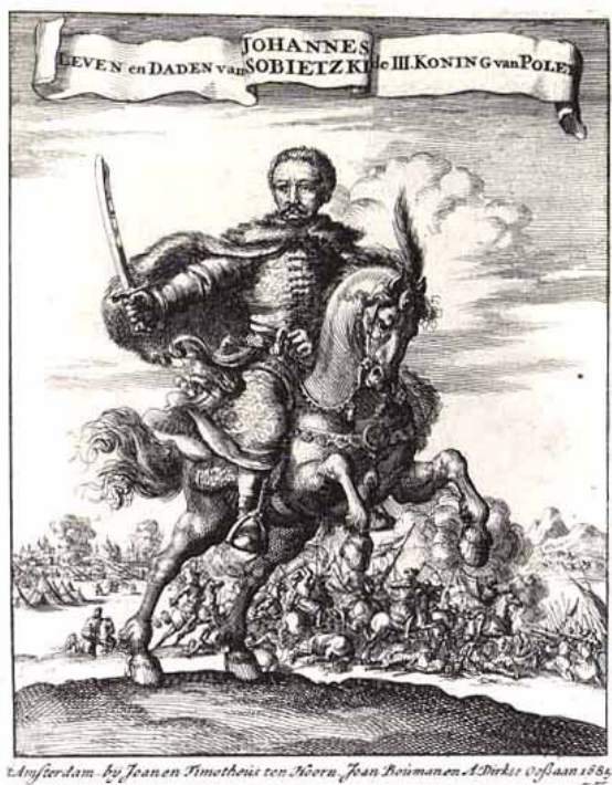
Ilustracja 2. Van der Linde Leven en daden van Johannes Sobietzki de III (Amsterdam, 1685 r.)