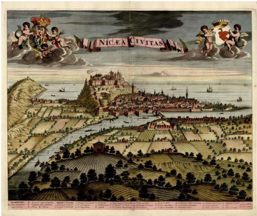
Ilustracja 3. Obiekt z europejskiej kolekcji planów fortyfikacji i bitew (1684-1709)

Źródło: https://www.loc.gov/resource/g5700m.gct00127a/?sp=9 .