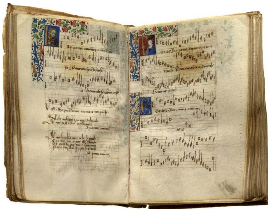
Ilustracja 5. Laborde Chansonnier (1470 r.)