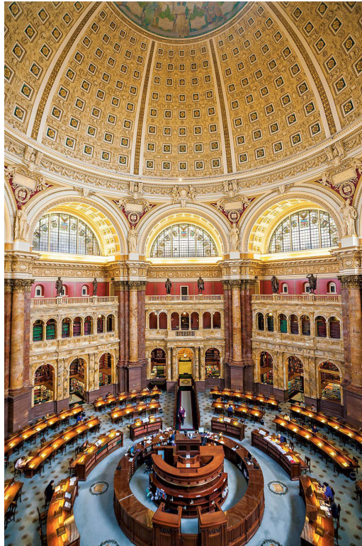
Ilustracja 4. Czytelnia Główna Biblioteki Kongresu