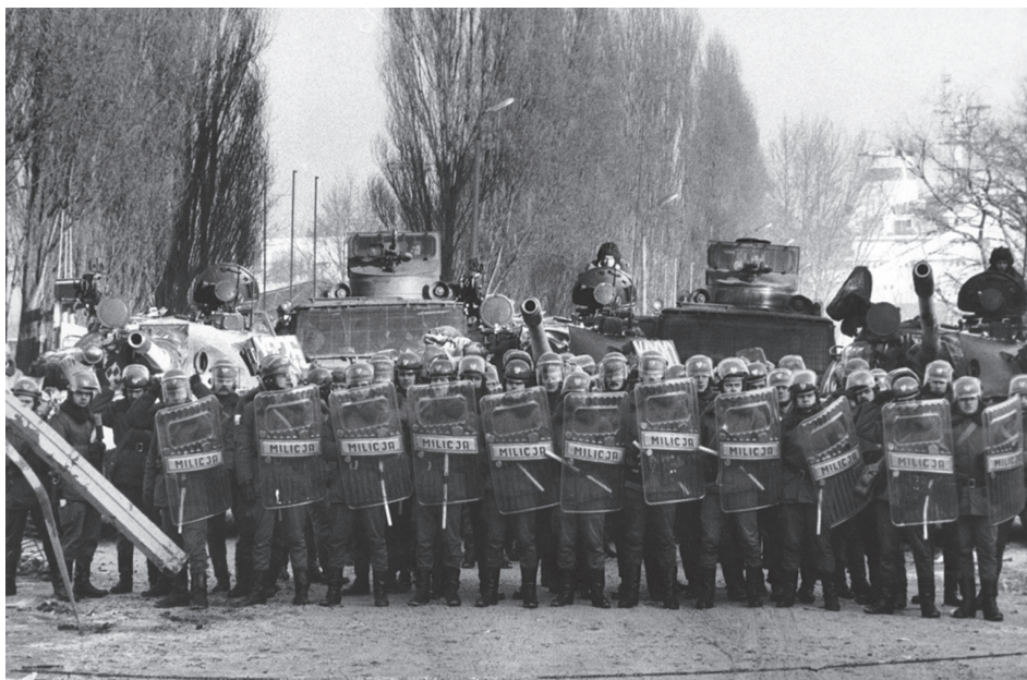
Il. 3. Kordon funkcjonariuszy ZOMO w czasie pacyfikacji Stoczni Gdańskiej im. Lenina, 16 grudnia 1981 r.