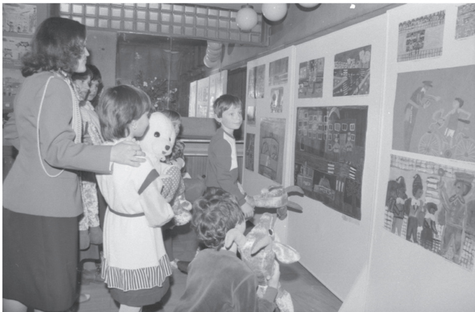
Il. 1. Otwarcie wystawy prac nagrodzonych w Ogólnopolskim Konkursie Plastycznym „Milicja Obywatelska w oczach dziecka”, Warszawa 1984 r.