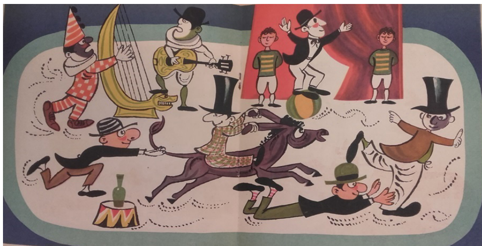
Il. 7. Ilustracja Piotra Baro z Cyrku z 1957 roku

Dalej następowały kolejne przekonujące zachęty do podziwiania innych artystów cyrkowych (il. 7).