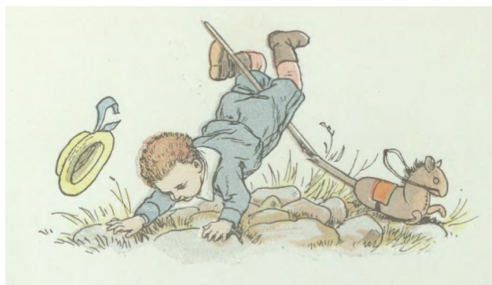
Il. 5. Rycina kolorowana według akwareli E. Tumana, ilustracja ze s. 26 do wierszyka ze zbioru Dobre dziatki – dobre matki...