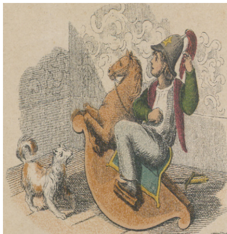
Il. 20. Tablica I Dom i rodzina z publikacji Świat i dzieci...