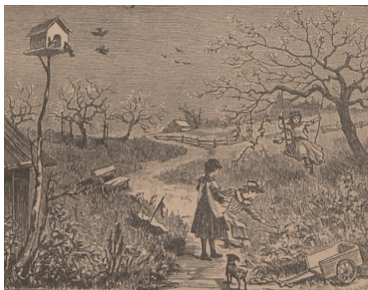
Il. 7. Ilustracja do czytanki Wiosna ze s. 47 Toruńskiego elementarza polskiego wydanego w 1901 roku

W Toruńskim elementarzu polskim zamieszczono liczne grafiki ukazujące sceny z dziecięcego świata, choćby zajęcia i zabawy dziecięce w poszczególnych porach roku (il. 7, 8, 9, 10). Wiosenna scena przedstawia dziewczynki w otoczeniu wiejskiej przyrody, wśród kwitnących kwiatów i drzew. Dwie z nich zbierają kwiaty, trzecia huśta się na huśtawce. Latem dzieci zaprezentowano w podobnej, wiejskiej scenarii. Dziewczynka z bukietem czeka, aż chłopiec zerwie z drzewa owoce. Na pierwszym planie widzimy ule, w tle furę z sianem. Ilustracja jesienna ukazuje grupę dzieci w sadzie: chłopcy kijami strącają jabłka, dziewczynki zbierają je do koszyków. Obrazek zimowy oddaje ulubione dziecięce zabawy o tej porze roku – bitwę na śnieżki i ślizgawkę.