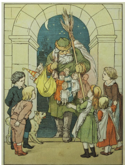
Il. 6. Rycina kolorowana według akwareli E. Tumana, ilustracja ze s. 41 do wierszyka ze zbioru Dobre dziatki – dobre matki...

Oto idzie dziadek biały. Jak się dzieci tu sprawiły? Dla tych co nie płaczą wcale i słuchają mamy, mam koniki, piękne lale strojne jak damy. Ale kto niegrzeczny był, jemu sam różgę dam, będę walić co mam sił ( ibidem : 40).