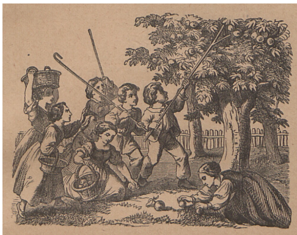
Il. 9. Ilustracja do czytanki Jesień ze s. 53 Toruńskiego elementarza polskiego