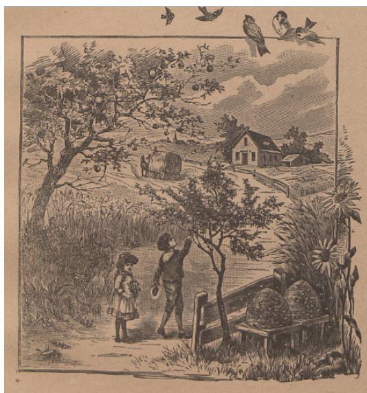
Il. 8. Ilustracja do czytanki Lato ze s. 48 Toruńskiego elementarza polskiego