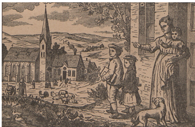
Il. 11. Ilustracja z okładki Toruńskiego elementarza polskiego

i chłopiec, trzymający pod pachami książki, opuszczają dom, udając się na lekcje. W progu żegna ich trzymająca na rękach młodsze dziecko matka. Można przypuszczać, że czyni ona nad dziećmi znak krzyża, błogosławiąc ich na czas nauki w szkole. Na innej grafice, już z wewnętrznych kart elementarza (il. 12), jest kilkuletni, pilny uczeń siedzący na niskim stołeczku, który skupiony i z zapalem pisze coś piórem w kajecie. Ilustrację dołączono do części tekstu służącej do nauki pisania liter i składania ich w sylaby. Została opatrzona komentarzem: „[...] należy każdą głoskę pisać z osobna, po kilkanaście lub kilkadziesiąt razy, według potrzeby” ( Toruński elementarz polski z obrazkami zastosowany do potrzeb dzieci, uczących się w szkole tylko po niemiecku 1901: 17). Chłopiec na ilustracji miał zapewne towarzyszyć dzieciom w ich trudach nauki pisania liter.