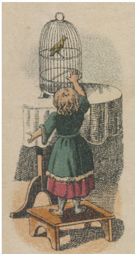
Il. 19. Tablica I Dom i rodzina z publikacji Świat i dzieci...