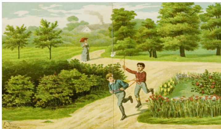
Il. 15. Tablica XIII zamieszczona w Kolorowanych tablicach poglądowych do nauki o rzeczach