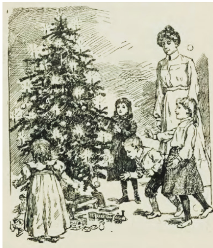
Il. 2. Ilustracja do wiersza Choinka , zamieszczona w 13 numerze czasopisma „Moje Pisemko” z 1908 roku na s. 219

A co tam cacek z barwnej bibułki, chyba wam Tolek policzy... O, już niedługo, jeszcze chwileczka, o już gwiazdeczka wam świeci, Choinka dumna szepce z uśmiechem – chodźcie, zobaczą mnie dzieci! (Michalina Ch. 1908: 219–220)