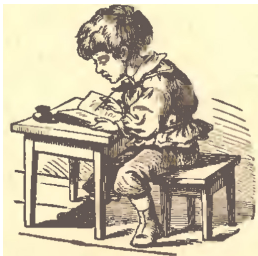
Il. 12. Ilustracja ze s. 17 Toruńskiego elementarza polskiego