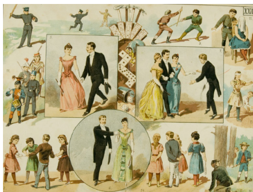
Il. 16. Tablica XXIV zamieszczona w Kolorowanych tablicach poglądowych do nauki o rzeczach