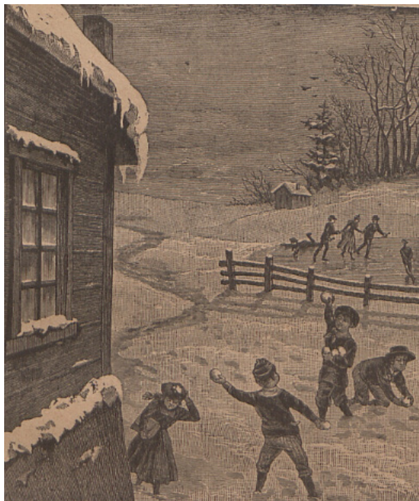
Il. 10. Ilustracja do czytanki Zima ze s. 57 Toruńskiego elementarza polskiego

Na przykładzie grafik z elementarza toruńskiego można zaobserwować także problematykę kształcenia szkolnego. Na grafice zamieszczonej na stronie tytułowej widzimy scenę wyjścia do szkoły (il. 11). Dwoje starszych dzieci, dziewczynka