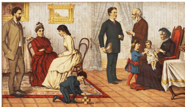
Il. 14. Tablica I zamieszczona w Kolorowanych tablicach poglądowych do nauki o rzeczach Adolfa Dygasińskiego wydanych w 1890 roku