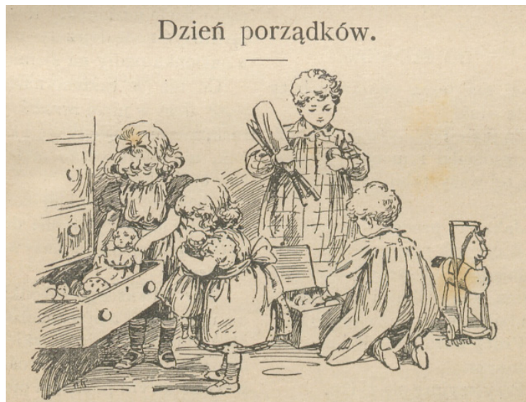
Il. 1. Ilustracja do wiersza Dzień porządków z czasopisma „Świątek Dziecięcy. Bezpłatny dodatek do Przyjaciela Dzieci” z 1913 roku, znajdująca się w numerze 19 na s. 145

Gdzie brak guziczka, rączka żywa natychmiast guzik ten przyszywa. Wzorowe całe gospodarstwo, nic tam pod kurzu nie jest warstwą. Wszystko czyściutkie, poskładane, do szuflad pięknie pochowane. Konik drewniany wyczyszczony, ład i porządek z każdej strony, Że aż wokoło wszystko świeci. Czemu nie wszystkie takie dzieci? ( Dzień porządków 1913: 145–146)