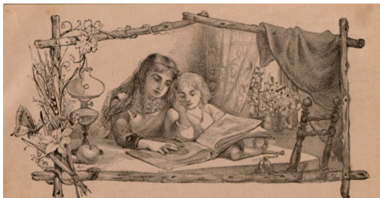
Il. 3. Winieta czasopisma „Mały Świątek. Czasopismo ilustrowane dla dzieci i młodzieży” z 1894 roku