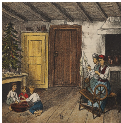
Il. 17. Tablica XII zamieszczona w Kolorowanych tablicach poglądowych do nauki o rzeczach