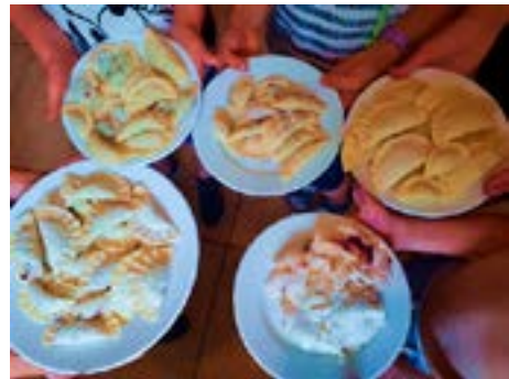
Photograph 2. Stasiu's dumplings side by side with dumplings made by other children