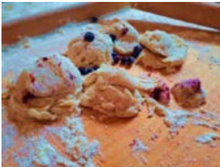
Photograph 1. Stasiu's dumplings