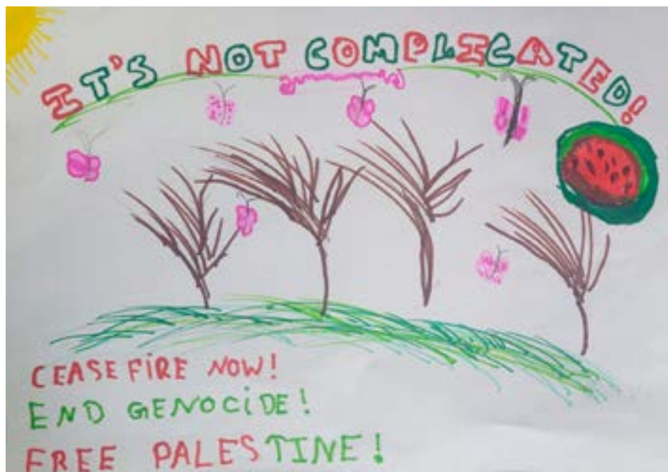
Fot. 3. Rysunek ośmioletniej Ayaany de Chickera towarzyszący wpisowi Amalowi de Chickera

Listy są tłumaczone na różne języki, w tym na arabski. Zresztą cała inicjatywa Reimagining Childhood Studies jest przykładem praktyki krytykującej europocentryczny charakter studiów nad dzieciństwem. Listy zaczęły podróż po różnych krajach w formie wystawy. W Polsce listy były odczytywane i pisane w różnych miejscach: w Poznaniu na festiwalu Etnoport, w Lublinie w Stowarzyszeniu dla Ziemi, we Wrocławiu i w Krakowie w Instytutach Etnologii i Antropologii Kulturowej, w Warszawie w Pracowni Etnograficznej 4 . Być może kiedyś będą odczytywane dzieciom w Palestynie. Włączając się w tę inicjatywę, włączając w nią także dzieci (część rysunków i listów jest ich autorstwa), w jakiś sposób współtworzymy współczesne dzieciństwa, podejmujemy polityczną decyzję o tym, kogo i w jaki sposób wspierać, co kwestionować i poddawać krytyce, jak mówić o świecie przemocy i kryzysów. Jak uprawiać studia nad dzieciństwem we współczesności, w której zbyt często odbierane jest dzieciom prawo do bezpiecznego dzieciństwa.