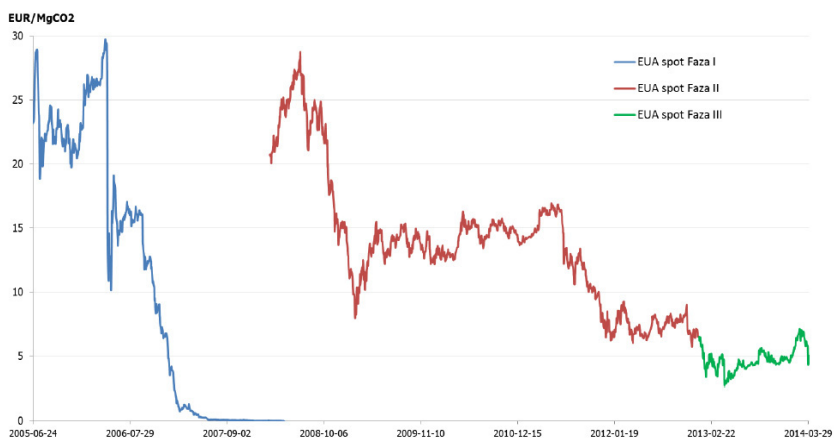
Rysunek 3. Notowania uprawnień do emisji CO 2 w latach 2005-2014

Kluczowym elementem idei handlu emisjami jest to, by emitenci o niższych kosztach redukcji emisji chcieli zmniejszać emisję poniżej wielkości określonej w ich pozwoleniu i sprzedawać niewykorzystane uprawnienia innym podmiotom, których koszty redukcji są wyższe. W ten sposób handel emisjami automatycznie powinien spełnić warunek minimalizacji kosztów społecznych osiągnięcia określonego poziomu redukcji emisji. Jednakże, stagnacja gospodarcza w Unii Europejskiej ogranicza popyt na energię, powodując spadek jej cen oraz spadek cen uprawnień do emisji, w związku z brakiem konieczności ich nabywania 14 .