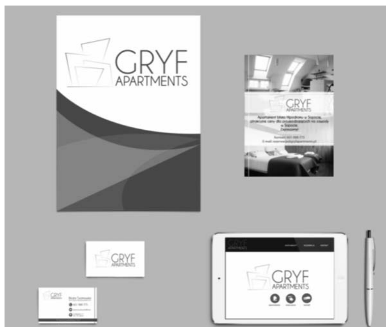
Rysunek 2. Przykład identyfikacji wizualnej dla firmy GRYF Apartmens wykonanej przez Agencję Reklamową Admaker