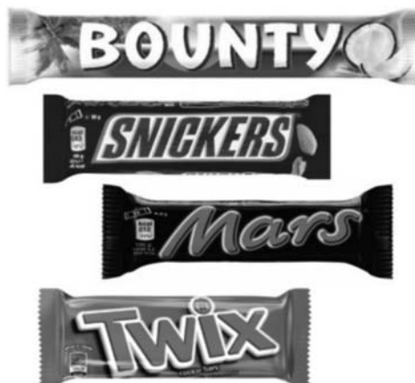
Rysunek 1. Przykład różnych marek batonów firmy globalnej MARS

Interesującym zjawiskiem dotyczącym marek jest fakt, że obecnie wiele osób decyduje się na prowadzenie kilku marek pod jedną firmą. Największe globalne przedsiębiorstwa tworzą marki dla produktów tej samej dziedziny, różniąc je nie tylko pod kątem składników, ale i pod kątem graficznym np. logo, opakowanie, materiały reklamowe 4 . Przykład różnych marek batonów firmy globalnej MARS został przedstawiony na rysunku 1.