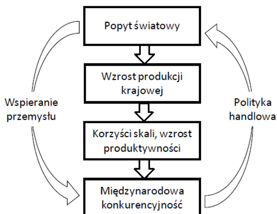
Rysunek 2. Krąg narastających korzyści

uzyskiwano efekt komplementarnych sprzężeń zwrotnych, w której części opierając strategię rozwoju kraju na eksporcie.