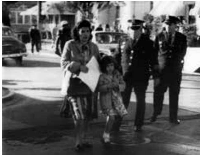
The Children Were Watching (1960).

Dlaczego filmowcy kina bezpośredniego, najwyraźniej stroniący (poza nielicznymi wyjątkami) od drażliwych tematów, akurat kwestię praw ludności murzyńskiej potraktowali inaczej? Złożyło się na to kilka czynników. Po pierwsze, był to problem najbardziej nabrzmiały, od dawna obecny w życiu publicznym. W odróżnieniu od innych zapalnych kwestii, które w znacznej mierze przedostały się do świadomości opinii publicznej dopiero w drugiej połowie lat sześćdziesiątych, problem praw ludności murzyńskiej tlił się w społeczeństwie amerykańskim od XIX wieku, a najświeższa fala protestów i niezadowolenia zaczęła wzbierać pod koniec lat pięćdziesiątych. Po drugie, dla znacznej części białej ludności z północy Stanów Zjednoczonych dyskryminacja ludności murzyńskiej była poważnym problemem moralnym, domagającym się jak najszybszego rozwiązania. Z tej właśnie grupy rekrutowali się wszyscy właściwie członkowie kina bezpośredniego, którzy, co trzeba podkreślić, pod względem rasowym i etnicznym stanowili nader jednorodny zespół, składający się wyłącznie z WASP-ów, białych, wykształconych Anglosasów. Po trzecie wreszcie, nie wolno zapominać, że filmowcy bezpośredni działali w środowisku telewizyjnym, zatem reagowali na zapotrzebowanie rynku telewizyjnego. Tak się składa, że akurat kwestii praw obywatelskich telewizja amerykańska ery Kennedy'ego, a także i później, poświęcała niezwykle dużo czasu antenowego. Filmowcy bezpośredni nie mogli pozostać na to obojętni.