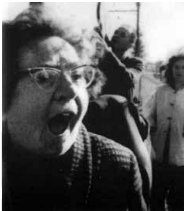
The Children Were Watching (1960).