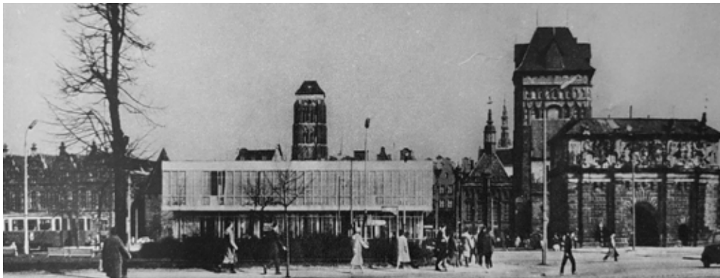
Il. 1. Dom Meblowy na tle Głównego Miasta, repr. za: „Architektura” 1962, nr 11–12, s. 466