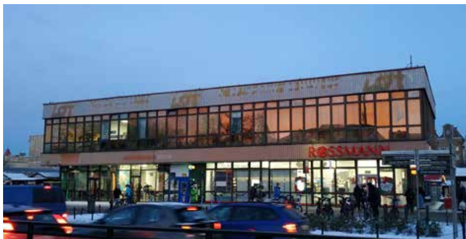
Il. 5. Dawny Dom Meblowy, widok od wschodu, stan w 2023 r.

Pawilon sprawia więc wrażenie zaniedbanego – i taki też jest; dzisiejszy wygląd jest efektem niefortunnej przebudowy przeprowadzonej ponad czterdzieści lat temu oraz niespójności w zakresie zarządzania obiektem. Sytuacja ta nie zmieniła się, mimo że pawilon został wpisany do gminnej ewidencji zabytków 49 oraz przylega on do układu urbanistycznego miasta Gdańska w obrębie nowożytnych fortyfikacji, będącego obszarem wpisanym do rejestru zabytków 50 .