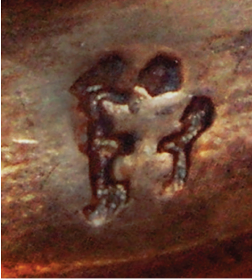
Il. 2. Znak miejski Gdańska używany około 1683 – przed 1688, wybity na barokowej stopie, użytej wtórnie do zamocowania krzyża relikwiarzowego w kościele parafialnym pw. św. Katarzyny z Aleksandrii w Braniewie