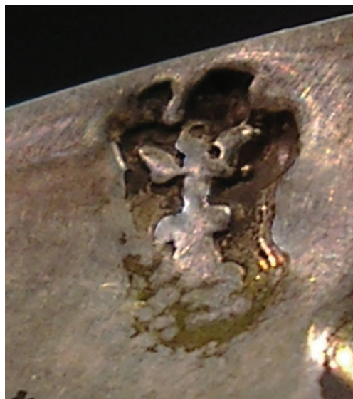
Il. 3. Znak miejski Gdańska używany około 1683 – przed 1688, wybity na czarce, zbiory Westpreußisches Landesmuseum w Münster, fot. Jutta Reisinger-Weber

W praktyce znaki wybite jedną i tą samą puncyną mogą znacznie się od siebie różnić. Przyczyny takiego stanu rzeczy mogą być bardzo różne – użycie puncyny uszkodzonej lub zanieczyszczonej drobkami srebra, co powoduje, że szczegóły jej rysunku stają się nieczytelne, lub wadliwe jej zastosowanie (zbyt słabe, za mocne bądź częściowe jej odbicie). Różnice mogą być spowodowane także zniszczeniem znaku, uszkodzeniami mechanicznymi (zarysowania, czyszczenie), oraz tym, że wyroby wykonane ze srebra wciąż „pracują”, ulegając powolnym, lecz nieodwracalnym odkształceniom. Potwierdza to porównanie wielu odbitek odmian przedstawionego tu znaku, których kształty w szczegółach nieco odbiegają od rysunków już opublikowanych 26 . Ponieważ jednak nie udało się odnaleźć na tyle dobrze zachowanych cech, które pozwoliłyby na wykonanie nowych rysunków, w przypadku znaku nr 5E poprzestaliśmy na razie na odpowiednim zmodyfikowaniu rysunku wykonanego i opublikowanego przez Gradowskiego. Jednak już teraz tak przedstawiony znak oraz zarysowana chronologia użycia w Gdańsku znaków nr 5A–E pozwalają na nieco dokładniejsze datowanie zabytków tutejszego złotnictwa.