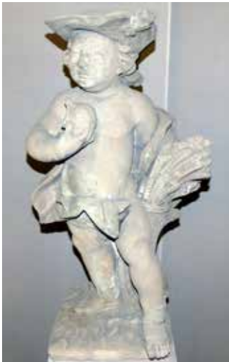
Il. 27. Georg Christoph Sommer, Personifikacja lata , Germanisches Nationalmuseum-Nürnberg

prawdopodobieństwem, że figura wiosny – przeznaczona do ekspozycji na parkanie pałacu Mniszchów – posiadała atrybuty w postaci kwiatów.