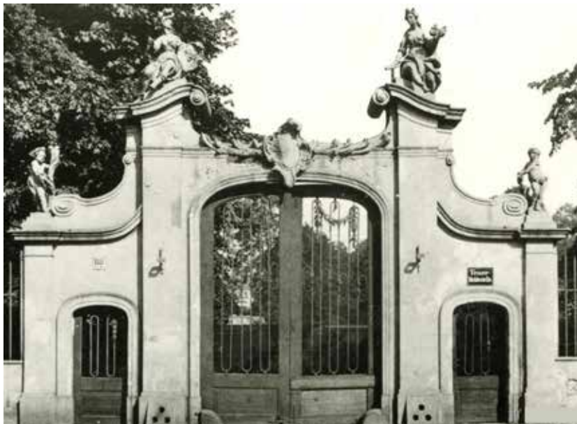
Il. 4. Brama pałacu Mniszchów przy Długich Ogrodach, pocztówka, fot. domena publiczna

Rozmieszczenie i układy poszczególnych figur wyraźnie sugerują, że zostały one wykonane z myślą o ustawieniu w miejscach docelowych. Wprowadzono układ antytetyczny. Kobięce personifikacje oraz flankujące bramę putta zwracają się w stronę osi wyznaczonej przez główny przejazd. Ogrodzenie nie istnieje, lecz zarówno większość przedstawień figuralnych, jak i wazy zachowały się i stanowią część zbiorów Muzeum Narodowego w Gdańsku 13 . Cały zespół rzeźb wykonanych z piaskowca datuje się na około 1750 r. 14 Wzmianka archiwalna o zakupie przez Mniszcha w 1751 r. 15 posesji, na której wzniesiono pałac, pozwala na określenie czasu powstania figur na pierwszą połowę lat pięćdziesiątych XVIII w. Godna podkreślenia jest stylistyka rzeźb – utrzymanych w konwencji rokokowej.