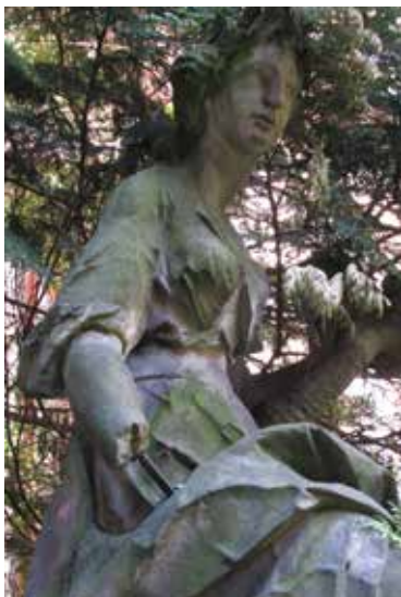
Il. 7–8. Ceres, rzeźba z ogrodzenia pałacu Mniszchów w Gdańsku, Muzeum Narodowe w Gdańsku, fot. Alina Barczyk, 2018

opiera się o gałąź z winnymi gronami (il. 10). Putto stwarza wrażenie, jakby element floralny był niezbędny dla zachowania przez nie równowagi. Kiść winogron wieńczy też prawą skroń figury. Obie postacie cechuje ekspresja kompozycji, przerysowanie i świadome zniekształcanie proporcji ciał oraz mimiki. Twarze mają wydatne policzki i ciężkie powieki opadające na oczy o głęboko drażonych źrenicach (il. 11). Nogi są zbyt krótkie w porównaniu z tułowiem, brzuchy przesadnie wystające. Przystylizowane były zwłaszcza głowy – nadmierne deformacje ciężko uzasadnić nawet faktem, że figury były przeznaczone do ustawienia powyżej linii wzroku i obserwacji w skrócie perspektywicznym. Akcentowanie zbyt obfitych partii ciała współgra z różnicowaniem faktur atrybutów i miękkim modelunkiem form (il. 12).