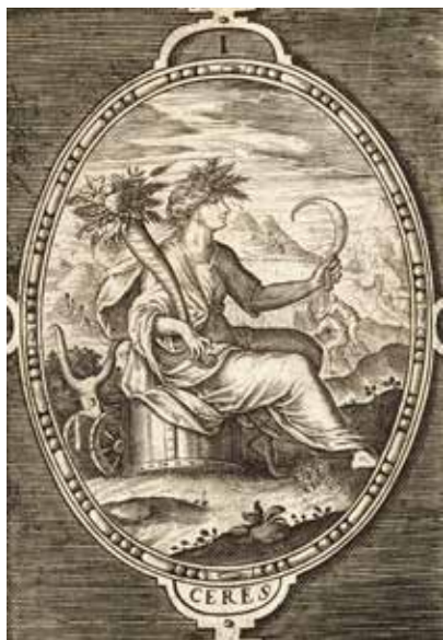
Il. 22. Chryspin de Passe, Virgilio Solis, Ceres , atrybucja, Herzog Anton Ulrich-Museum w Brunshwiku, fot. domena publiczna