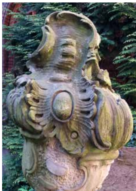
Il. 15. Wazy z ogrodu pałacu Mniszchów w Gdańsku, Muzeum Narodowe w Gdańsku, fot. Alina Barczyk, 2018