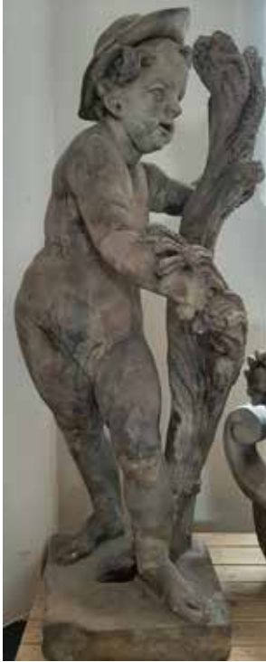
Il. 9. Lato , putto z ogrodzenia pałacu Mniszców w Gdańsku, Muzeum Narodowe w Gdańsku, fot. Alina Barczyk, 2018