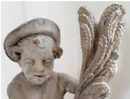
Il. 11. Lato , putto z ogrodzenia pałacu Mniszców w Gdańsku, detal, Muzeum Narodowe w Gdańsku, fot. Alina Barczyk, 2018