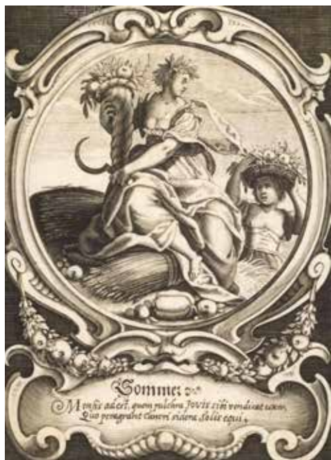
Il. 24. Raphael Custos, Cztery pory roku. Lato , Herzog Anton Ulrich-Museum w Brunshwiku, fot. domena publiczna