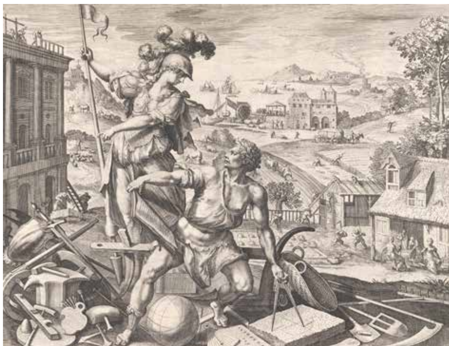
Il. 20. Raphael Sadeler, Labor , cykl Cztery etapy życia ludzkiego , The Metropolitan Museum of Art w Nowym Jorku, fot. domena publiczna

handlu – Merkury 53 . Co oczywiste, powyższa triada odwoływała się w istocie do głównych filarów rozwoju Gdańska 54 . Powszechnie posługiwano się wyobrażeniami czterech pór roku, utożsamianych z żywiołami 55 . W XVI–XVIII w. motyw ten pojawiał się w figurach ogrodowych 56 , dekoracjach sieni patrycjuszowskich domów 57 , reliefach zdobiących meble, a także w rzemiośle artystycznym (zegarach, figurkach ceramicznych) 58 . Na szafach gdańskich porom roku niejednokrotnie towarzyszyła Cerera 59 . Znaczenie wiosny, lata, jesieni i zimy