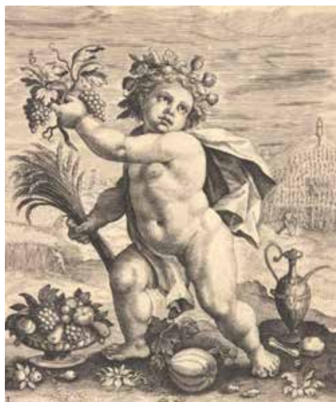
Il. 25. Chrystian de Passe, Geniusz jesieni, Herzog Anton Ulrich-Museum w Brunshwiku

w dłoniach pęk kłosów zboża oraz gałązkę z kiśćmi winogron (il. 25). Owoce, leżące na paterze i rozrzucone na ziemi, są również dostrzegalne w dolnej partii sceny. Źródło obrazowania pór roku można poszukiwać bez wątpienia w Ikonologii Cesare Ripy, wiążącego alegorię wiosny z kwieciami 81 i zwierzętami, lata z wieńcem z pszenicznych kłosów – bądź z przedstawieniem Cerery ze snopkiem – zaś jesieni z rogiem obfitości i winnymi gronami. Do zimy miało przynależać odzienie z płatów skóry lub przykryta głowa 82 . Mimo wprowadzanych modyfikacji główne elementy symboliki były zawsze zachowane. Ich recepcja jest dostrzegalna również w dekoracji parkanu pałacu Mniszchów. Putta zapewniły spójny charakter przekazu – obrazując pory roku, zaakcentowano idee pomyślności i obfitości (Ceres) oraz apoteozę mądrości, odnoszącej się m.in. do kwestii sztuki (Minerwa).