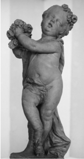
Il. 26. Jan Baptist Xavery, Pory roku. Lato – bozzetto , Landesmuseum w Kassel