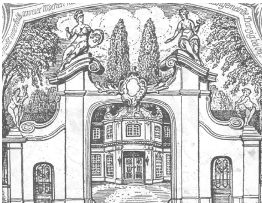
Il. 3. 1 milion marek, banknot Wolnego Miasta Gdańska, detal