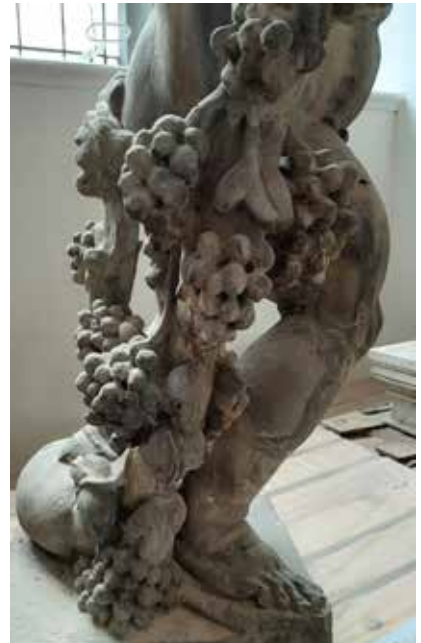
Il. 12. Jesień , putto z ogrodzenia pałacu Mniszców w Gdańsku, detal, Muzeum Narodowe w Gdańsku, fot. Alina Barczyk, 2018