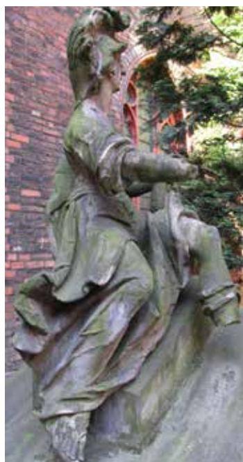
Il. 5–6. Minerwa , rzeźba z ogrodu pałacu Mniszchów w Gdańsku, Muzeum Narodowe w Gdańsku, fot. Alina Barczyk, 2018