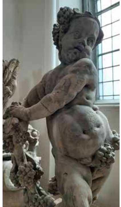
Il. 10. Jesień , putto z ogrodzenia pałacu Mniszców w Gdańsku, Muzeum Narodowe w Gdańsku, 2018