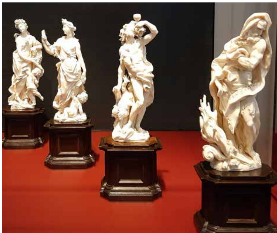
Il. 29. Balthasar Permoser, Cztery pory roku , Grünes Gewölbe w Dreźnie, fot. Alina Barczyk, 2019

więc teza, iż dekorację figuralną ogrodzenia powinno się rozpatrywać w szerszym kontekście, przywracającym motywom ich głębszą wymowę. Warto jednak podkreślić, że postacie Ceres i Minerwy wprowadzono do najbardziej reprezentacyjnych przestrzeni. Można je dostrzec chociażby w dekoracji klatki schodowej biskupiej rezydencji w Würzburgu, w scenie gloryfikacji tamtejszego księstwa i samego księcia biskupa Carla Philippa von Greiffenclau na czterech kontynentach 96 . O aktualności programu ikonograficznego w Gdańsku świadczy fakt, że würzburskie malowidło powstało w tym samym okresie, w latach 1752–1753 97 . Interesująco rozwiązano też kompozycję sceny Gloryfikacja Cesarstwa Karola VII , którą Carlo Innocenzo Carloni namalował w pałacu Augustusburg około 1750–1752 r. 98 Widoczna jest na nim siedząca Minerwa, trzymająca