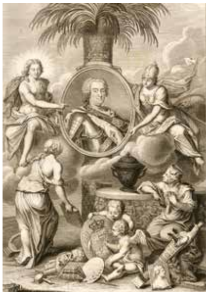
Il. 21. Raymond Leplat, Recueil des marbres antiques qui se trouvent dans la Galerie du Roy de Pologne à Dresden , frontysepis, Staatlichen Kunstsammlungen w Dreźnie