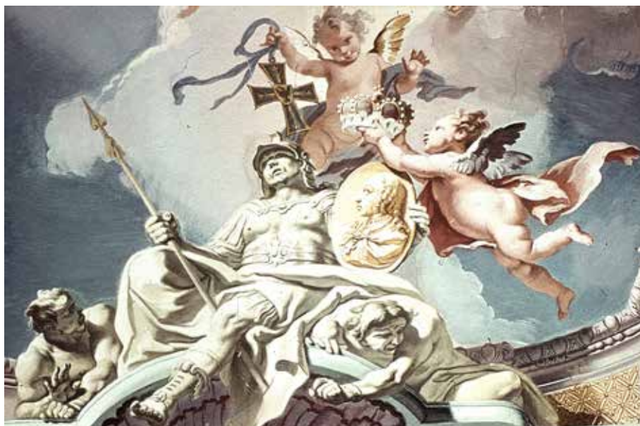
Il. 30. Carlo Innocenzo Carloni, Gloryfikacja Cesarstwa Karola VII, Schloss Augustusburg

w dłoni medalion z wizerunkiem władcy, ponad którym putto unosi koronę (il. 30).