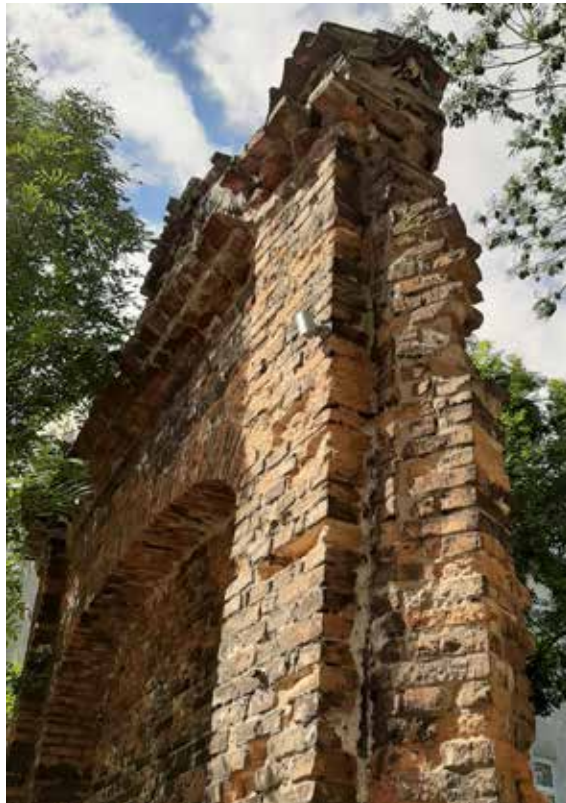
Il. 2. Relikty wschodniej partii ogrodzenia pałacu Mniszchów w Gdańsku, fot. Alina Barczyk, 2019