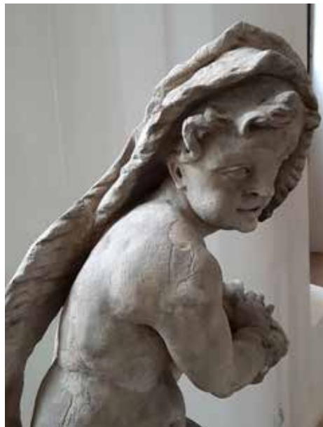
Il. 13–14. Zima , putto z ogrodu pałacu Mniszchów w Gdańsku, Muzeum Narodowe w Gdańsku, fot. Alina Barczyk, 2018