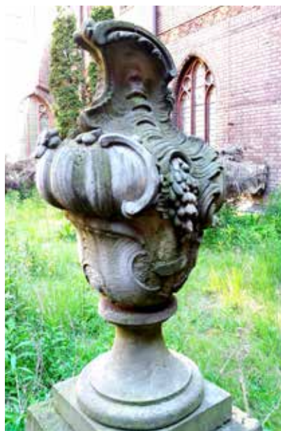
Il. 16. Wazy z ogrodu pałacu Mniszchów w Gdańsku, Muzeum Narodowe w Gdańsku, fot. Alina Barczyk, 2018