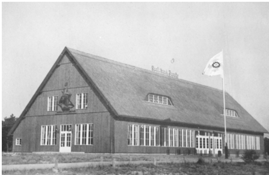
Il. 14. Hala plażowa Kraft durch Freude w Gdańsku Wisłoujściu, proj. Otto Frick (budynek nie istnieje)

Zgodnie z projektem architekta Ottona Fricka 136 powstała hala w konstrukcji fachimowej z odeskowaniem, przykryta dwuspadowym dachem krytym strzechą i lukarnami, z trzech stron doświetlona oknami ze szprosami 137 . Budynek ustawiono równolegle do linii brzegowej Zatoki Gdańskiej. Na południowej elewacji szczytowej zawieszono ponad wejściem płaskorzeźbioną kogę z emblematem KdF-u na żaglu 138 , na północnej zaś większe logo KdF-u. W prasie wskazywano, że hala naśladuje wyglądem dawne budownictwo wiejskie 139 . Wnętrze budynku zdominowały proste elementy z drewna – otwarta więźba dachowa, stoły i ławki, a także podest i dwie empory muzyczne przy ścianach szczytowych. W budynku organizowano zebrania, koncerty i wieczory taneczne oraz sprzedawano przekąski plażowiczom (obiekt mógł jednocześnie pomieścić około 1300 osób). Jesienią 1938 r. zapowiedziano, że już