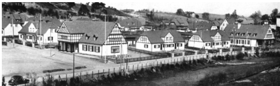
Il. 4. Dawne osiedle NSDAP w Sopocie Kamiennym Potoku, widok od strony ul. Obodrzyców, po lewej stronie Dom Wspólnotowy (Kameradschaftshaus), po prawej stronie Dom Młodzieży (Haus der Jugend)

W latach 1934–1938 władze miejskie Sopotu zbudowały w Kamiennym Potoku na użytek NSDAP (Steinfließ), w kwartale pomiędzy ulicami Kriegerheimstätten, Heimstraße, Brodwinstraße (późniejszą Am Steinfließ) i Kameradschafts-Weg (między obecnymi ulicami Małopolską, Łużycką, Obodrzyców i Junaków), kolejne malownicze osiedle, złożone z dziewięciu domów i dwóch budynków (il. 4).