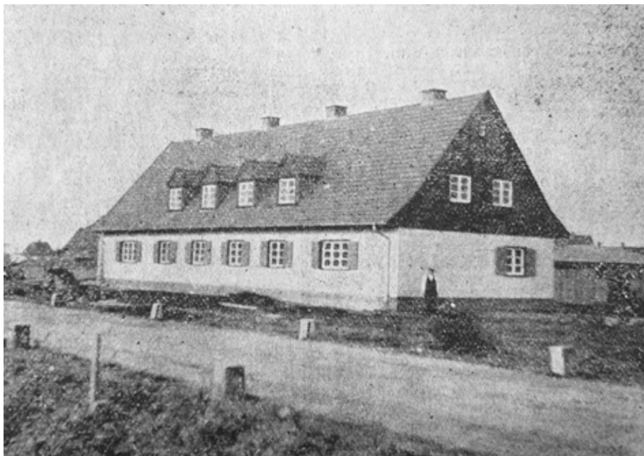
Il. 2. Fragment osiedla spółdzielni Daheim w gdańskich Rudnikach, ul. Tarniny 44, repr. za: „Danziger Vorposten” 1938, nr 134

nizinny krajobraz osiedle zachwalano w prasie jako „łączące zalety życia na wsi z udogodnieniami, jakie może zaoferować miasto” 39 .