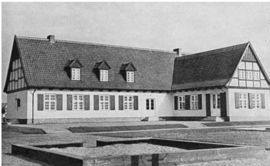
Il. 8. Dawne przedszkole NSV w Pruszczu Gdańskim przy ul. J. Kochanowskiego 8, proj. Bruno Marg

zauważono, że pozostali uczestnicy konkursu również często wykorzystywali w swoich projektach motyw podcienia 97 .