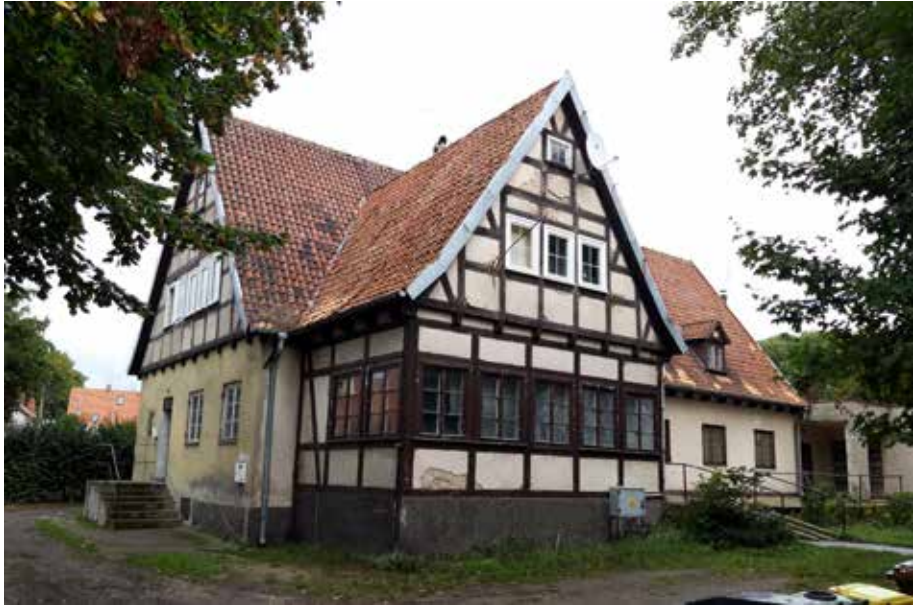
Il. 9. Dawne przedszkole NSV w Gdańsku Brzeźnie przy ul. Mazurskiej 6, proj. Bruno Marg