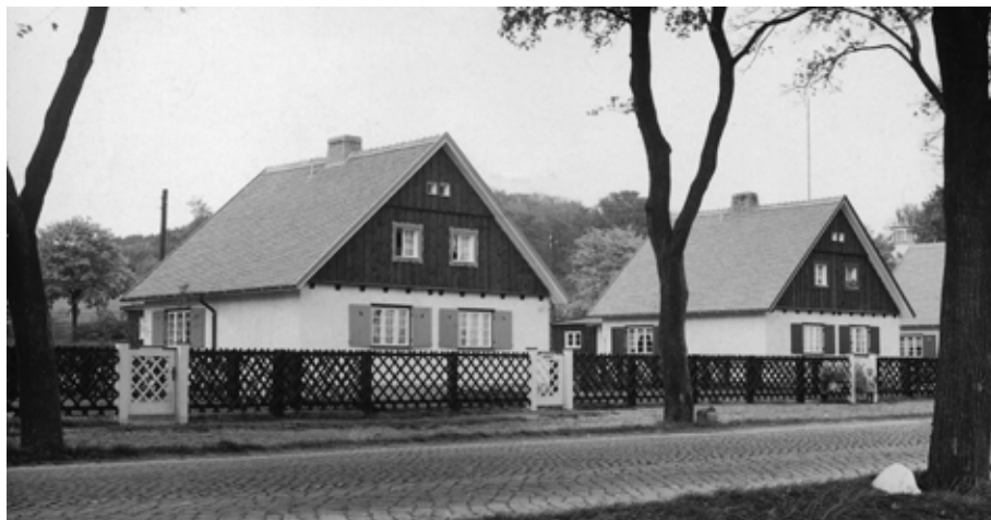
Il. 3. Fragment osiedla Zielony Trójkąt (Grünes Dreieck), pierwotnie w granicach Sopotu, obecnie przy al. Grunwaldzkiej w Gdańsku, fot. ze zbiorów Krzysztofa Ciesiula

domów trzyrodzinnych) 43 . Drugi etap, trwający od września 1936 r. do października 1937 r., obejmował pięć domów przy obecnej ul. Czyżewskiego i dwa domy przy łączącej obie drogi ul. Nawodnej 44 . Proste budynki na rzucie prostokąta, z dwuspadowym dachem i szerokimi lukarnami, wzbogacono o szprosły okienne, dekoracyjne opaski wkoło drzwi i okien, drewniane okiennice, knagi podokapowe oraz deskowania szczytów. Zarówno w bliźniakach, jak i w domach trzyrodzinnych każde z mieszkań posiadało dostęp do piwnicy, obszerną kuchnię i duży pokój na parterze, a na piętrze dwie sypialnie 45 . Do każdego domu przynależały: mały dekoracyjny ogród przed domem (uprawiany według projektu wspólnego dla całego osiedla) i większy ogród po stronie tylnego dziedzińca, z możliwością hodowli zwierząt 46 . Szacowano, że docelowo na terenie osiedla zamieszka około