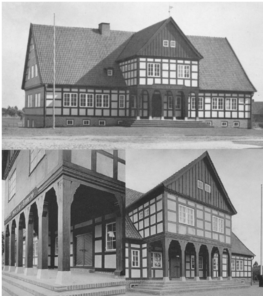
Il. 7. Dawny Dom Młodzieży (Haus der Jugend) w Nowym Dworze Gdańskim, proj. Gerhard Plagens (budynek nie istnieje), repr. za: Willi Drost, Kunstschaffen im Deutschen Danzig , Danzig 1939, il. 115, E. Erich Kulke, Die Laube als ostgermanisches Baumerkmal , Munchen, il. 360, 361

miu znajdowały się: dwupokojowe mieszkanie dozorczy, pomieszczenie na rowery, szpiźnia, kotłownia, trzy pomieszczenia biurowe oraz natryski 89 . Główne wejście do budynku prowadziło poprzez podcień wsparty na sześciu filarach. Na piętrze usytuowano dużą salę (o wymiarach około 6 × 12 m) urządzoną w stylu wiejskiej izby, dwa pomieszczenia biurowe, gabinet lekarski 90 i kuchnię wydającą posiłki