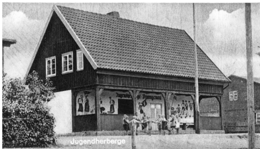
Il. 6. Dawne schronisko młodzieżowe w Pęgowie, proj. Helmut Fritzler, dekoracje malarskie Ernst Oldenburg, fot. ze zbiorów Krzysztofa Ciesiula

ściennymi z wizerunkami członków Hitlerjugend, Bund Deutschen Mädel i Deutsches Jugendvolk, które wykonał młody malarz Ernst Oldenburg 82 .