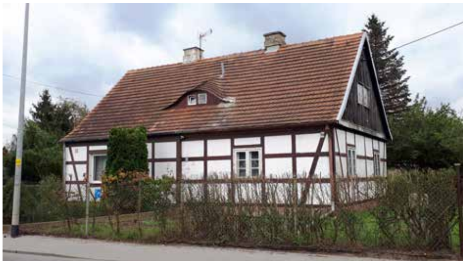
Il. 1. Fragment osiedla Feya w Gdańsku Olszynie, dom bliźniaczy przy ul. Olszyńskiej 16–18, fot. Jagoda Załęska-Kaczko

(projekty domów) 25 . Osiedle składało się z trzydziestu trzech parterowych bliźniaków z dwuspadowym dachem i zblizzonego formą domu wspólnotowego z przedszkolem (1938) 26 , rozmieszczonych wzdłuż dwóch ulic w układzie owalnicowym. Budowę realizowano dwuetapowo – w listopadzie 1936 r. zawieszono wiechę nad dwudziestoma bliźniakami 27 , a w lipcu 1937 r. oddano je do użytku i rozpoczęto drugi etap (trzyście bliźniaków) 28 , ukończony latem 1938 r. 29 . Trzypokojowe mieszkania z kuchnią i łazienką, położone w osmiusetmetrowym ogrodzie, były przeznaczone dla robotników i urzędników należących