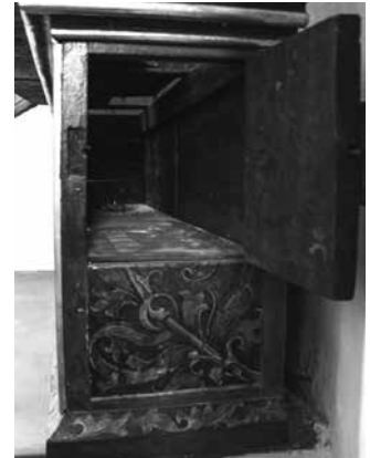
Il. 12. Predella z Biczowaniem i Koronowaniem Cierniem (prawa ścianka boczna, górna półka), 1490–1500, Gdańsk, kościół Najświętszej Marii Panny

Za gdański produkt uznaje się predellę z Chrystusem i apostołami 13 z ołtarza Tryptyku pochodzącego z kościoła parafialnego św. św. Piotra i Pawła w Helu. Predella ma formę skrzyni z konsolami o wklęsłym profilu spływów. Drzwiczki (niezachowane) umieszczono w obu bocznych ściankach. Wnętrze stanowi pusta przestrzeń bez półek. Predella jest stosunkowo niska (niższa od tej z ołtarza św. Jadwigi), można zatem przypuszczać, iż pierwotnie nie miała półki.