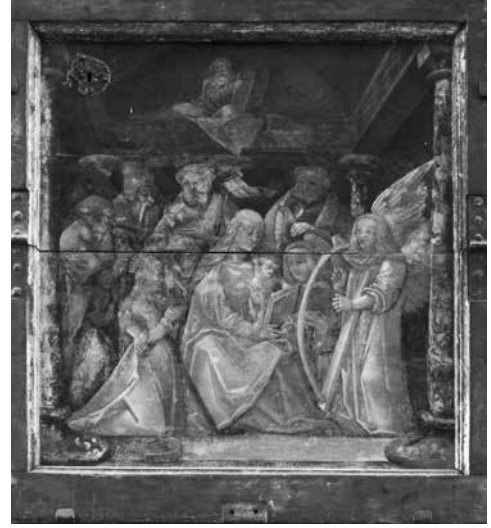
Il. 7. Kwatera z Marią z Dzieciątkiem w otoczeniu świętych predelli ołtarza głównego w kościele Najświętszej Marii Panny, około 1517, kościół Najświętszej Marii Panny, Gdańsk