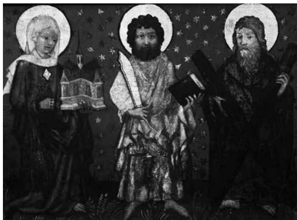
Il. 3. Predella ze świętymi z retabulum św. Jadwigi (detal), około 1435, kościół Najświętszej Marii Panny, Gdańsk

Na większości predell częściowo zachowały się różnego typu okucia. Przede wszystkim są to zawiasy, które scalają poszczególne deski lub kwatery tworzące front predelli oraz łączą ruchome partie frontu z ramą bądź drzwiczki z predellą. Innego rodzaju okucia służyły do mocowania ruchomych świecz-