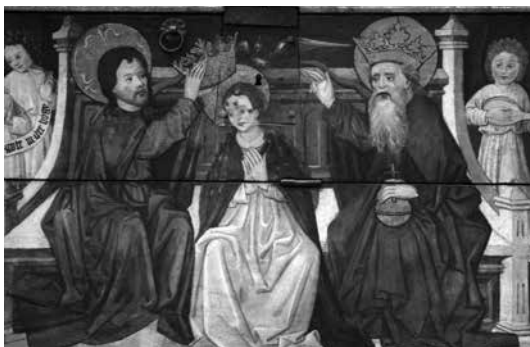
Il. 15. Predella Koronacji Marii przez Trójcę Świętą w otoczeniu świętych z retabulum fundacji balwierzy i cyrulików (detal), około 1490, kościół Najświętszej Marii Panny, Gdańsk

Predella z Mężem Bolesci i świętymi z ołtarza Tłoczni Mistycznej 27 również posiadała częściowo otwierany front w środkowej partii, jednak w tym przypadku ruchome były obie poziome deski obejmujące całą wysokość predelli.