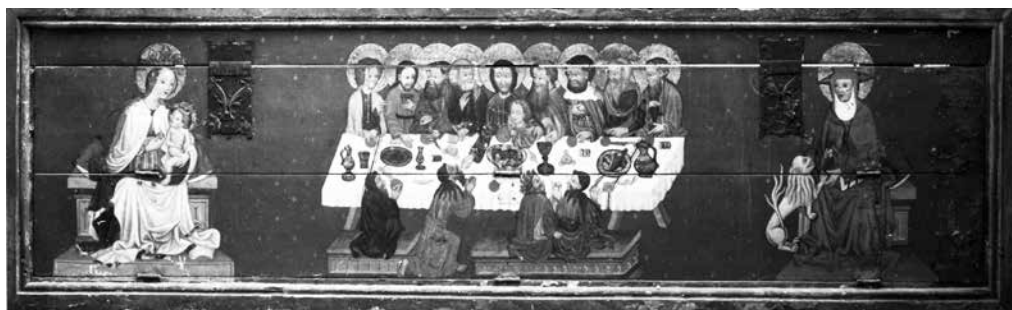
Il. 19. Predella z Ostatnią Wieczerzą, Marią z Dzieciątkiem i św. Hieronimem, 1435–1440, kościół Najświętszej Marii Panny, Gdańsk

Na terenie Gdańska pojawiły się również predelle, w których ściana frontowa była w całości otwierana. Zachowały się dwa takie przykłady: predella z Ostatnią Wieczerzą, Marią z Dzieciątkiem i św. Hieronimem 35 (il. 19), której lico składa się z dwóch poziomych, ruchomych desek, połączonych zawiasami, oraz predella z Koronacją Marii w otoczeniu proroków z ołtarza Bractwa Kapłańskiego NMP (por. il. 4, 20–22), której front tworzą trzy ruchome deski.