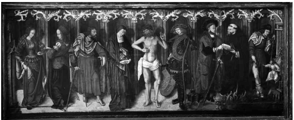
Il. 5. Predella z Mężem Bolesci i świętymi z retabulum św. Rajnolda, 1516, kościół Najświętszej Marii Panny, Gdańsk, Muzeum Narodowe w Warszawie