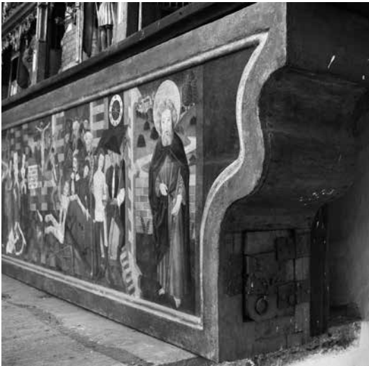
Il. 8. Predella ze sceną męczeństwa św. Adriana z retabulum fundacji cechu rzeźników (prawa ścianka boczna), około 1470, kościół Najświętszej Marii Panny, Gdańsk, fot. Paweł Wroniak

zostały przez cechy rzeźników świadczyć może o zamożności lokalnych cechów, natomiast nie powinien stanowić podstawy do formułowania zbyt daleko idących wniosków. Predelle nie były prawdopodobnie dziełami miejscowych warsztatów (korpus nastawy św. Adriana był bez wątpienia importem, chociaż sama predella, od początku przeznaczona do tej szafy, mogła zostać wykonana w Gdańsku). Z całą pewnością nie były też efektem pracy tego samego warsztatu, na co wskazuje nie tylko różnica w czasie powstania obu dzieł, lecz także ich wyraźna odmienność stylistyczna i konstrukcyjna. Kształt konsolek i wpuszczona w głęboką wnękę płaskorzeźbiona scena Ostatniej Wieczery , flankowana przez namalowane