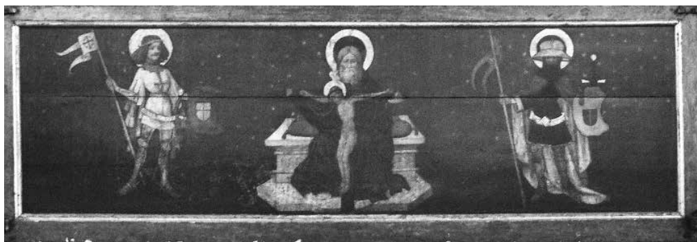
Il. 13. Predella z Trójcą Świętą , św. Jerzym i św. Olafem z retabulum Trójcy Świętej , 1435–1440, kościół Najświętszej Marii Panny, Gdańsk, Berlin–Moabit, kościół św. Jana

z Mężem Boleści z ołtarza Boga Ojca 20 . W predellach skrzyniowych z konsolkami drzwiczki zajmują niemal całą prostą powierzchnię ściany bocznej i kończą się tuż pod konsolą. W predellach bez konsolek drzwiczki nie zajmują całej powierzchni ściany bocznej. W predelli ze scenami z życia Marii mają one wysokość zbliżoną do połowy wysokości skrzyni i umieszczone są pośrodku ściany bocznej, a w predelli z Mężem Boleści z ołtarza Boga Ojca – mimo że stosunek ich wysokości do wysokości całej predelli jest podobny – znajdują się bliżej dolnej krawędzi skrzyni. Taka konstrukcja – ze stosunkowo niewielkimi drzwiczkami tylko z jednej strony – uniemożliwiała swobodny dostęp do całego wnętrza dwumetrowej skrzyni.