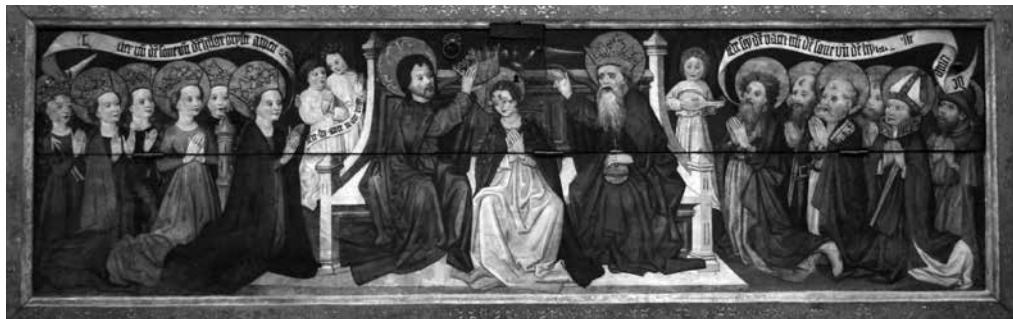
Il. 14. Predella Koronacji Marii przez Trójcę Świętą w otoczeniu świętych z retabulum fundacji balwierzy i cyrulików, około 1490, kościół Najświętszej Marii Panny, Gdańsk, fot. Paweł Wroniak

predell, gdyż pierwszej nie można otworzyć (brak klucza), natomiast dwie kolejne zaginęły 25 .