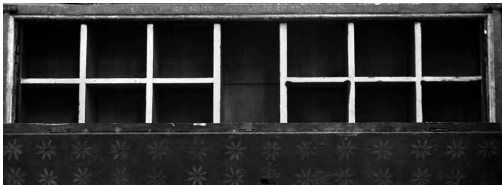
Il. 18. Predella ze Zwiastowaniem i prorokami z retabulum św. Doroty (wnętrze), 1435–1440, kościół Najświętszej Marii Panny, Gdańsk

Predella ze Zwiastowaniem i prorokami 31 w nastawie św. Doroty ma formę skrzyni z konsolami o wklęsłym profilu spływów. Lico z malowaną sceną figuralną skonstruowane jest z trzech przylegających do siebie poziomych desek. Dzieło to stanowi najstarszy zachowany przykład predelli z terenów