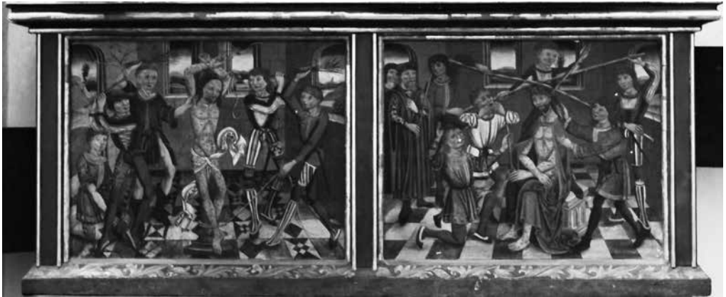
Il. 11. Predella z Biczowaniem i Koronowaniem Cierniem , 1490–1500, Gdańsk, kościół Najświętszej Marii Panny

nieruchomych kwater. W obu ściankach bocznych – podobnie jak w predelli z nastawy św. Jadwigi – znajdują się drzwiczki, a wewnątrz jest podzielone poziomą półką biegnącą przez całą długość predelli. Jednak drzwiczki umieszczono na różnych wysokościach. Dlatego też do górnego poziomu można mieć dostęp jedynie po otwarciu drzwiczek znajdujących się po prawej stronie, a do dolnego – po otwarciu drzwiczek z lewej strony.