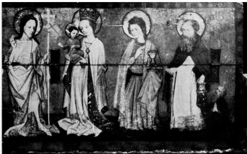
Il. 16. Predella z Chrystusem Zmartwychwstałym , Marią z Dzieciątkiem , św. Janem, św. Antonim i fundatorem, 1435–1440, kościół Najświętszej Marii Panny, Gdańsk, obecnie zaginiona, repr. wg Willego Drosta, Die Marienkirche in Danzig und ihre Kunstschatze , Stuttgart 1963

Front predelli z Chrystusem Zmartwychwstałym , Marią z Dzieciątkiem , św. Janem, św. Antonim i fundatorem 28 tworzyły dwie poziome deski, z których górna była ruchoma (na zdjęciu widoczne są zawiasy). Nie wiadomo, czy na poziomie dolnej deski na jednej ze ścianek bocznych (bądź też na obu) znajdowały się drzwiczki. Nieznana jest również w pełni budowa zewnętrzna predelli oraz pozostała część pola obrazowego. Prawdopodobnie jednak predella ta nie posiadała konsolek. Fotografia archiwalna ukazuje tylko prawą część frontu. Drost wspomina o sporym ubytku z lewej strony 29 . Na podstawie układu kompozycyjnego można przypuszczać, że na brakującej części ukazano wizerunki dwóch świętych. Drost wspomniał również, że na odwrociu górnej deski znajdowały się namalowane popiersia Chrystusa i apostołów 30 . Informacja ta może sugerować, że również wewnątrz predelli, które po otwarciu deski stawało się widoczne dla odbiorcy, mogło mieć jakiś wystrój.