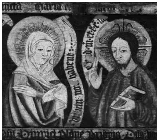
Il. 24. Predella z Chrystusem, Marią i apostołami z retabulum Koronacji Marii (detal), 1444, kościół poklasztorny, Kartuzy, fot. Weronika Grochowska

Front predelli z Dużego Ołtarza Ferberów składał się z dwóch kwater, z których każda miała oddzielny zamek znajdujący się na środku przy górnej krawędzi – zachowały się ich okucia. Sama predella miała formę prostopadłociennej skrzyni, co widoczne jest na fotografiach archiwalnych. Nie wiadomo, jak wyglądało wnętrze predelli, można jednak przypuszczać, że było podzielone – podobnie jak front – na dwie osobne wnęki. Drost wspomniał, że za ruchomymi kwaterami znajdowały się relikwiarze 41 . Możliwe zatem, że przestrzeń ta była w jakiś sposób zdobiona.