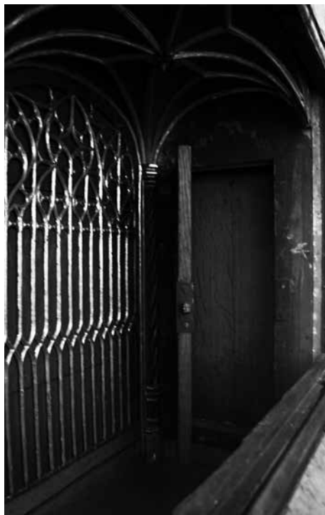
Il. 22. Predella Koronacji Marii w otoczeniu proroków z retabulum Bractwa Kapłańskiego Najświętszej Marii Panny (wnętrze – prawa ścianka), 1490–1500, kościół Najświętszej Marii Panny, Gdańsk

W Gdańsku pojawiły się również predelle, których front tworzyły dwie lub trzy oddzielne, ruchome kwatery. Zaliczyć do nich można dwie kwatery należące pierwotnie do zaginionej skrzyni predelli ze świątyni z Dużego Ołtarza Ferberów 38 , zaginione