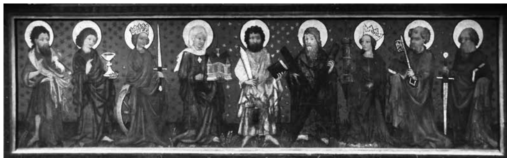
Il. 1. Predella ze świętymi z retabulum św. Jadwigi, około 1435, kościół Najświętszej Marii Panny, Gdańsk