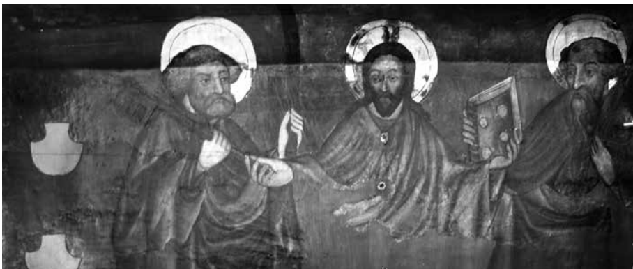
Il. 10. Predella ze scenami Traditio Legis i Traditio Clavis z retabulum św. Jakuba, 1435–1440, kościół Najświętszej Marii Panny, Gdańsk

Zupełnie nietypową budowę ma predella ze scenami Traditio Legis i Traditio Clavis z ołtarza św. Jakuba w kościele Panny Marii (il. 10). Wygięte lico stanowi jedyny widoczny element tej predelli, bowiem nastawa szczelnie wypełnia wnękę kaplicy. Charakterystyczne wygięcie ściany przypomina rozwiązanie