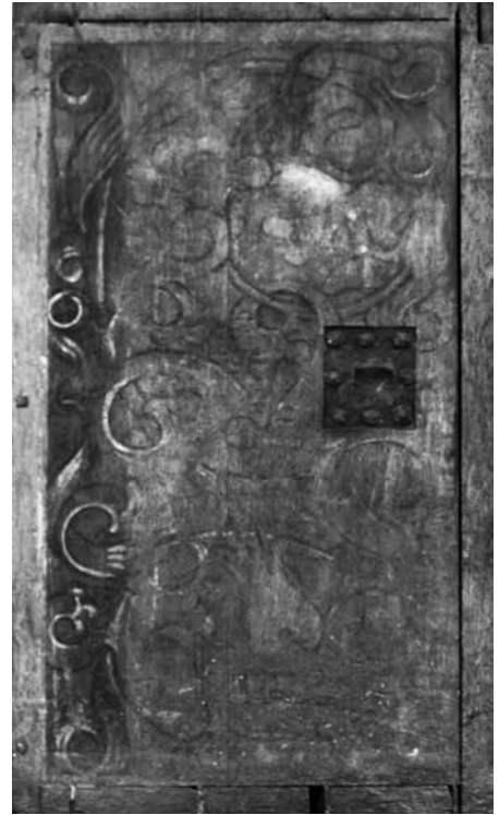
Il. 4. Predella Koronacji Marii w otoczeniu proroków z ołtarza Bractwa Kapłańskiego Najświętszej Marii Panny (lewa ścianka boczna), 1490–1500, kościół Najświętszej Marii Panny, Gdańsk, fot. Paweł Wroniak

Predelle ze sceną męczeństwa św. Adriana z ołtarza cechu rzeźników w kościele Panny Marii (il. 8) oraz z Ostatnią Wieczerzą i św. św. Dorotą i Apolonią z ołtarza fundacji cechu rzeźników staromiejskich w kościele św. Katarzyny (il. 9), które stanowią ciekawe warianty wspomnianych wyżej typów, można określić również jako trapezoidalne, bowiem skrzynia i konsole stanowią w nich jeden element zarówno pod względem wizualnym, jak i technicznym. W obu predellach konsole mają wklęsło-wypukły profil spływów. Fakt, że obie nastawy ufundowane