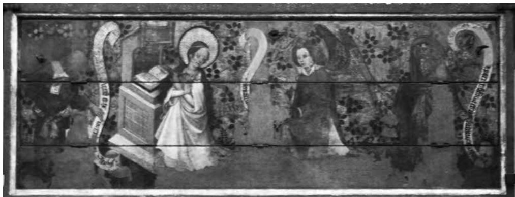
Il. 17. Predella ze Zwiastowaniem i prorokami z retabulum św. Doroty, 1435–1440, kościół Najświętszej Marii Panny, Gdańsk

Do drugiego typu predell – z trzema poziomymi deskami tworzącymi front (w tym dwiema ruchomymi) – należą: predella ze Zwiastowaniem i prorokami i ołtarz św. Doroty (il. 17, 18) oraz predella ze świętymi z ołtarza św. Mikołaja.