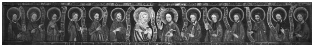
Il. 23. Predella z Chrystusem, Marią i apostołami z retabulum Koronacji Marii , 1444, kościół poklasztorny, Kartuzy

kwatery zagadkowej predelli ze Zmartwychwstaniem i Trójcą Świętą fundacji Filipa Bischofa 39 oraz predellę ołtarza głównego z kościoła Panny Marii 40 , z której zachowała się jedna spośród trzech kwater pierwotnie zdobiących front i jedna z trzech zdobiących tył. Żadna predella tego typu nie zachowała się w pierwotnym stanie.