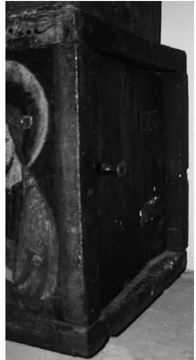
Il. 25. Predella z Chrystusem, Marią i apostołami z retabulum Koronacji Marii (prawa ścianka boczna), 1444, kościół poklasztorny, Kartuzy

Zachowana kwatera z frontu predelli ołtarza głównego w kościele Panny Marii przedzielona jest w poziomie na dwie równe części połączone zawiasami. W górnym lewym rogu znajduje się zamek z okuciem. Zdjęcia archiwalne pokazują, że pozostałe, niezachowane frontowe kwatery miały podobną konstrukcję. Zapewne górne połowy kwater można było otwierać. Stąd należy przypuszczać, że we wnętrzu musiała się znajdować pozioma półka. Możliwe, że przestrzeń ponad nią była również podzielona na trzy osobne