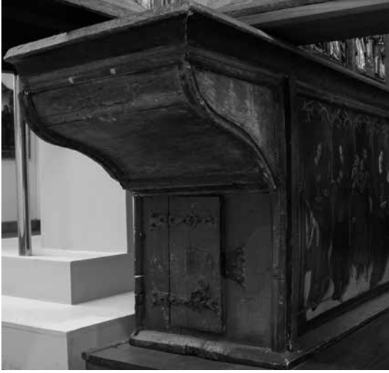
Il. 6. Predella z Mężem Boleści i świętymi z retabulum św. Rajnolda (lewa ścianka boczna), 1516, kościół Najświętszej Marii Panny, Gdańsk, Muzeum Narodowe w Warszawie