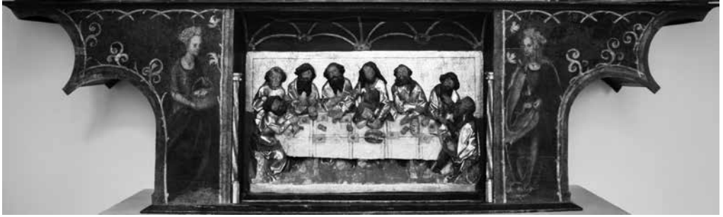
Il. 9. Predella z Ostatnią Wieczerzą , św. Dorotę i św. Apolonią z retabulum cechu rzeźników staromiejskich, około 1515, kościół św. Katarzyny, Gdańsk, Muzeum Narodowe w Gdańsku, fot. Agata Ciesielska

kolumnkami 8 . Forma taka przywodzi na myśl predelle nastaw pochodzących z Niemiec i ze Śląska, gdzie umieszczanie sceny płaskorzeźbionej we wnęce w centralnej części predelli było często stosowanym rozwiązaniem. W literaturze wielokrotnie pojawiały się przypuszczenia co do saskiej proweniencji nastawy 9 . Sama forma bocznych ścianek, które w widoku frontalnym mają niezwykle charakterystyczny wklęsło-wypukły, zaokrąglony profil, przypomina trochę wcześniejszą, pochodzącą z około 1490 r., mniej rozbudowaną predellę z ołtarza św. Franciszka z Rothenburga nad Tauberem, autorstwa Tilmana Riemenschneidera.