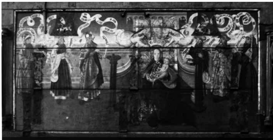
Il. 20. Predella Koronacji Marii w otoczeniu proroków z retabulum Bractwa Kapłańskiego Najświętszej Marii Panny , 1490–1500, kościół Najświętszej Marii Panny, Gdańsk