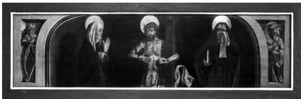
Il. 2. Predella z Mężem Bolesci , Matką Boską Bolesną i św. Janem z ołtarza Boga Ojca, około 1520, kościół św. Katarzyny, Gdańsk, Muzeum Narodowe w Gdańsku, fot. Agata Ciesielska

pojawiają się w źródłach archiwalnych w pierwszej połowie XIV w. 3 ). Zajmowali się oni głównie produkcją stołów, skrzyń i szaf. Najprawdopodobniej to właśnie w ich warsztatach powstawały również konstrukcje nastaw ołtarzowych, a przede wszystkim predell, których budowa w zasadzie nie różniła się wiele od skrzyń wykorzystywanych do innych celów (choć badania technologiczne kwater należących do predelli z Dużego Ołtarza Ferberów w kościele Mariackim wykazały, że ich konstrukcja bardziej wskazuje na produkt meblarski niż skrzyniowy 4 ). Wąska specjalizacja dziedzin wytwórczości, co stanowiło charakterystyczną cechę miast hanzeatyckich, powodowała, że nastawy ołtarzowe nie były produktem jednego warsztatu – konstrukcję skrzyń wykonywali najprawdopodobniej skrzyniarze, natomiast oprawą figuralno-ornamentalną zajmowali się inni specjaliści.