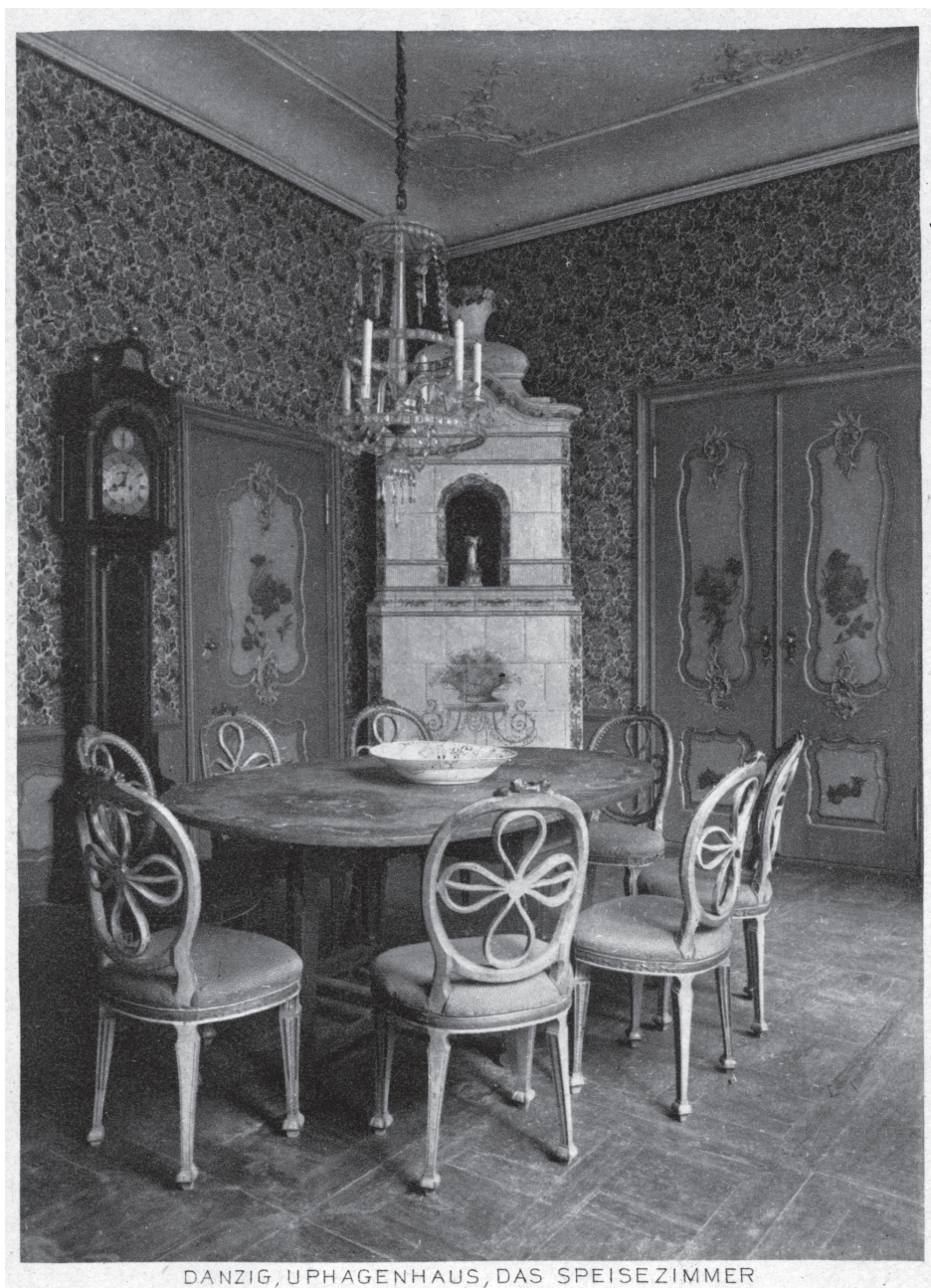
Ilustracja 3. Mała jadalnia w Domu Uphagena, fot. Gottheil und Sohn, około 1911 r., pocztówka Źródło: zbiory Muzeum Gdańska, oddział Dom Uphagena.