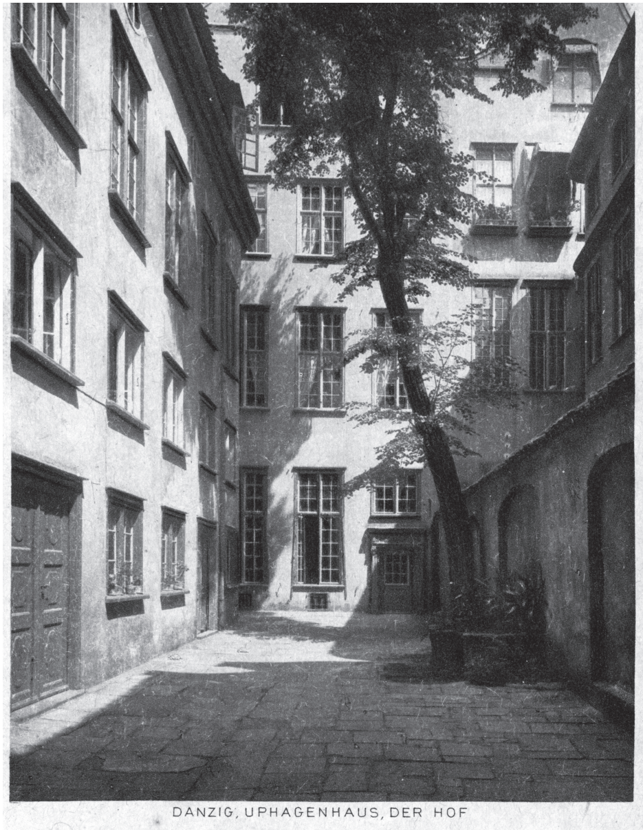
DANZIG, UPHAGENHAUS, DER HOF

Ilustracja 1. Podwórze Domu Uphagena, fot. Gottheil und Sohn, około 1911 r., pocztówka Źródło: zbiory Muzeum Gdańska, oddział Dom Uphagena.