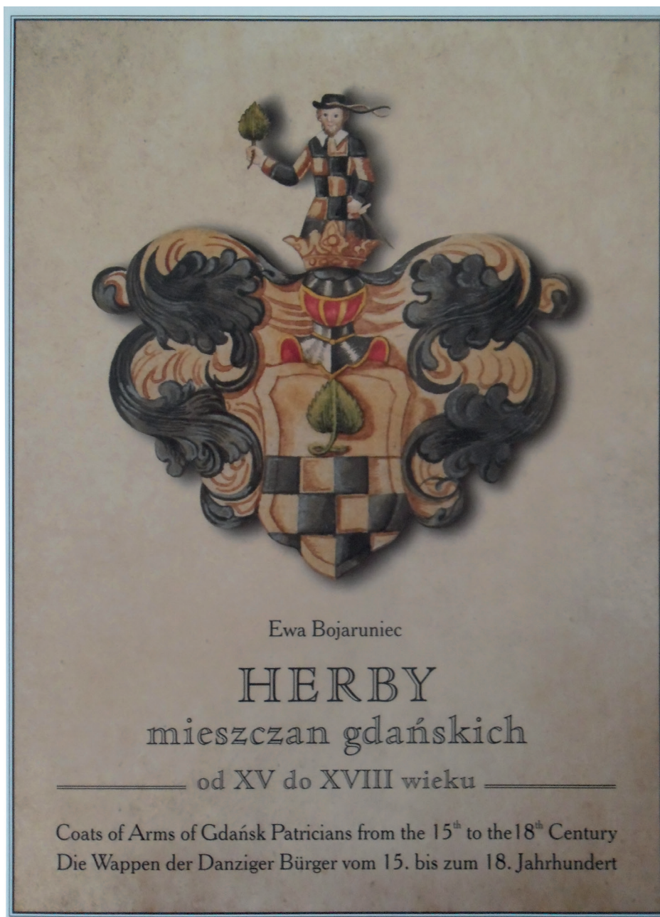
Ilustracja 7. Okładka publikacji towarzysząca wystawie Herby mieszczan gdańskich od XV do XVIII wieku