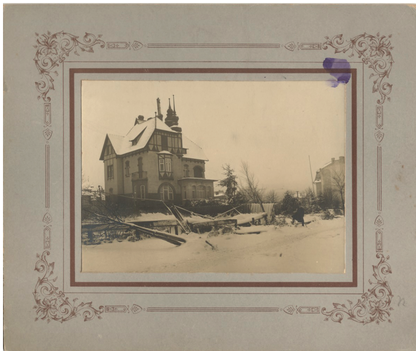
Ilustracja 1. Willa Claaszena w zimowej aurze

na piętrze oraz drugą na kalenicy dachu, z salonem z oryginalnym alabastrowym kominkiem, werandą oraz jadalnią. Obiekt posiada dekorację fachwerkową w szczytach elewacji, a także rozległy taras skierowany w stronę morza 14 (il. 1).