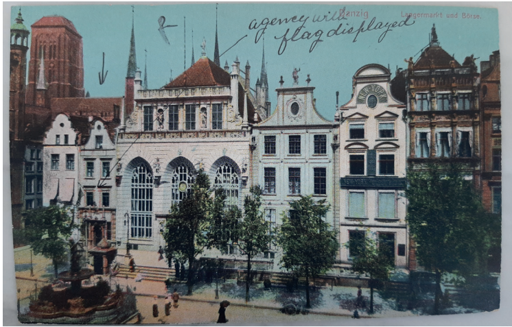
Ilustracja 3. Poczтівka z Gdańska załączona do raportu z kontroli zrealizowanej w listopadzie 1909 r. z adnotacją, że na budynku agencji konsularnej jest wywieszona amerykańska flaga