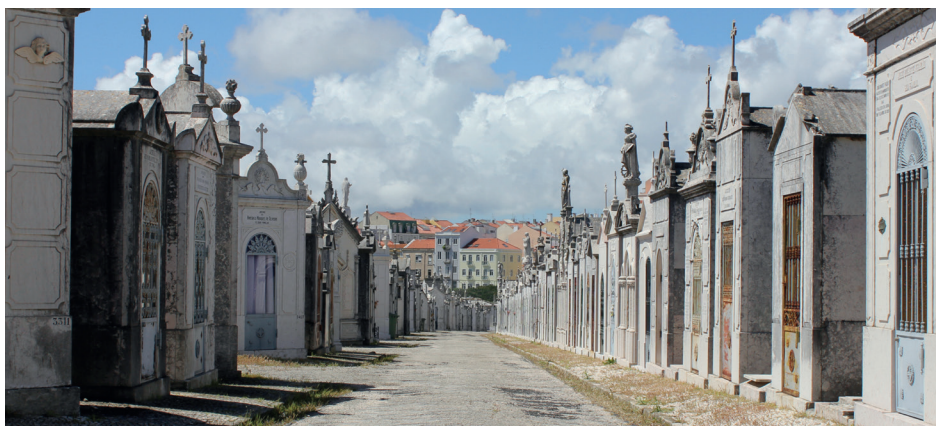
Ilustracja 3. Struktury pamięci , fotografia cyfrowa, Lizbona, 2022

W czasie intensywnej płynności – a coraz częściej: gwałtownych porywów i przepływów – rozpoznana forma daje schronienie, otula swojskością. Przypomina o wspólnocie myśli i wrażliwości.