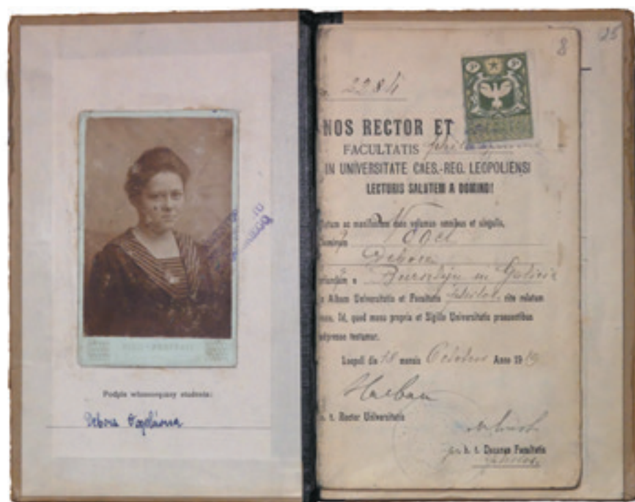
Podpis wiceprezesa studenckiego: