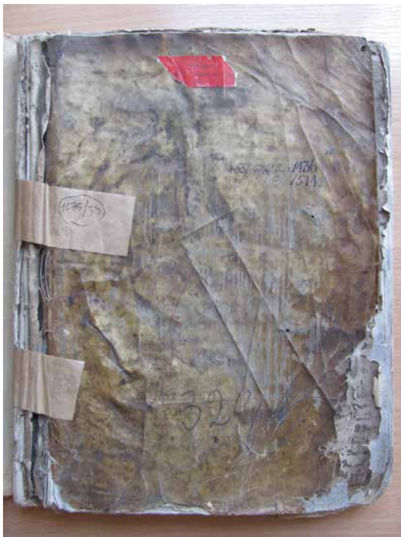
Fot. 1. Oprawa książki