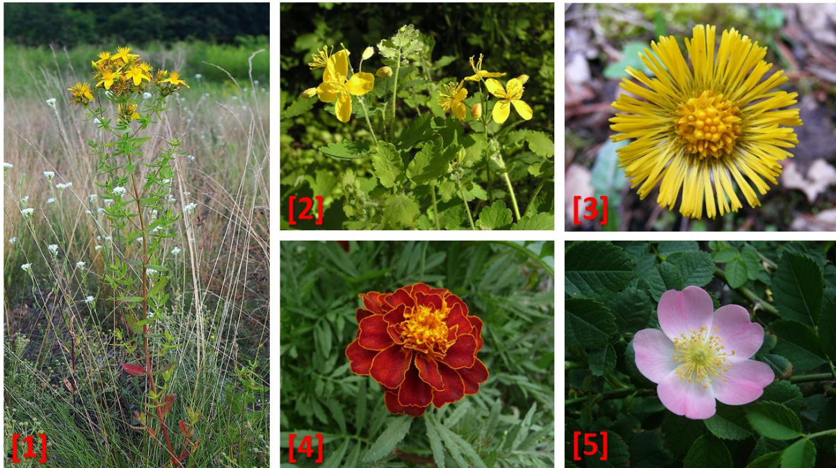
Ryc. 2. Zdjęcia wybranych roślin:

dzięki pigmentom karotenoidowym wykorzystywanym w barwieniu żywności (Vasudevan i in., 1997).