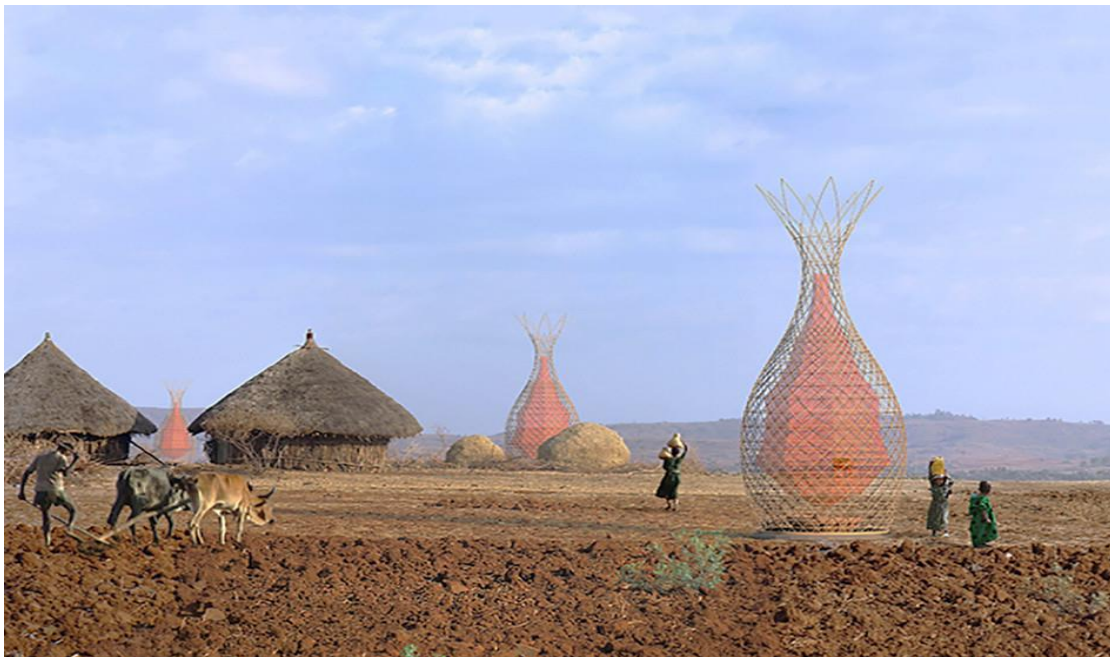
Ryc. 2. Projekt wież wodnych Warka w Etiopii [27]

gdzie dostęp do wody jest ograniczony często przez konieczność wyruszania w długie i niebezpieczne podróże, rozwiązaniem mogłoby być rozstawienie wież wodnych, które byłyby w stanie zbierać nawet 100 litrów wody dziennie dla miejscowych ludności [26]. Jednym z takich projektów są wieże wodne Warka zaprojektowane przez włoskiego architekta Arturo Vittori (Ryc. 2). Ich zadaniem właśnie byłoby zbieranie wody w miejscach, gdzie dostęp do wody lub dostawy jej są utrudnione, lub niemożliwe. Koszt jednej wieży to kwota pomiędzy 500 a 1000 dolarów [26] i nie wymaga dużej ilości konserwacji oraz wysokiej wiedzy technicznej do jej obsługi.